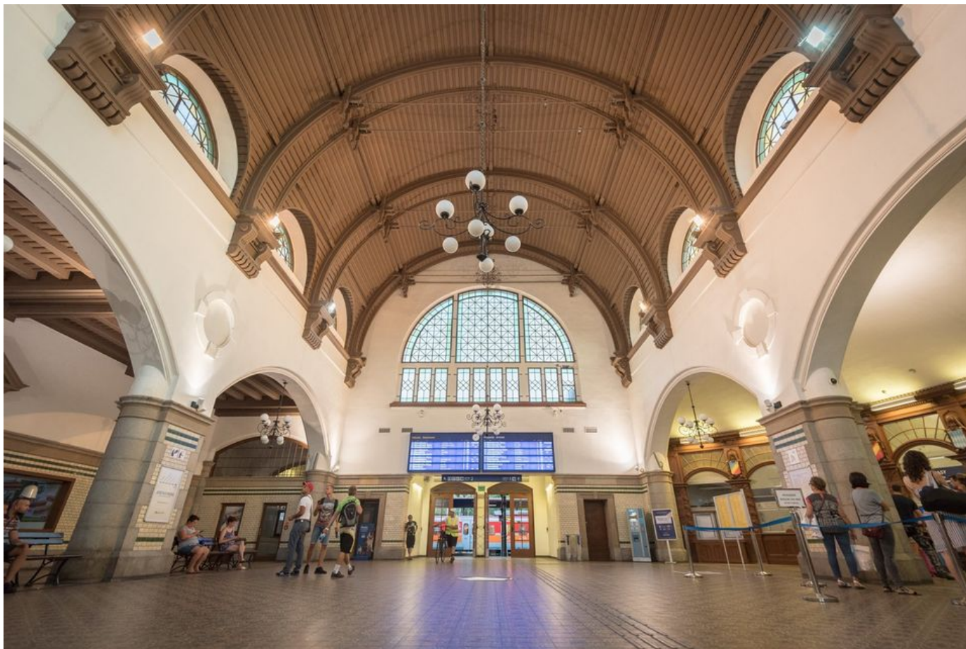
Dworzec Główny wewnątrz

Materiał powstał na podstawie książki autorstwa dr. Macieja Borkowskiego „Opole przełomów wieków XIX/XX”, Wydawnictwo Księży Młyn, 2015.