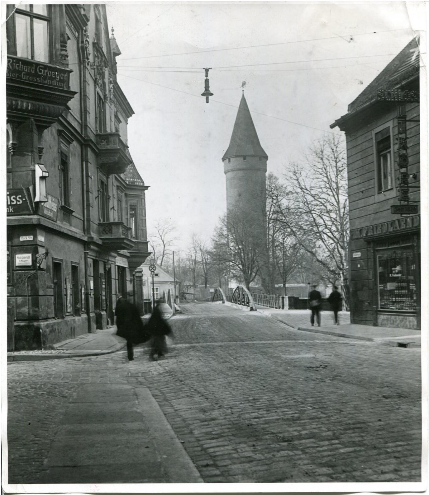
Ulica Zamkowa po rozbiórce Zamku Piastowskiego, ok. 1930 rok.