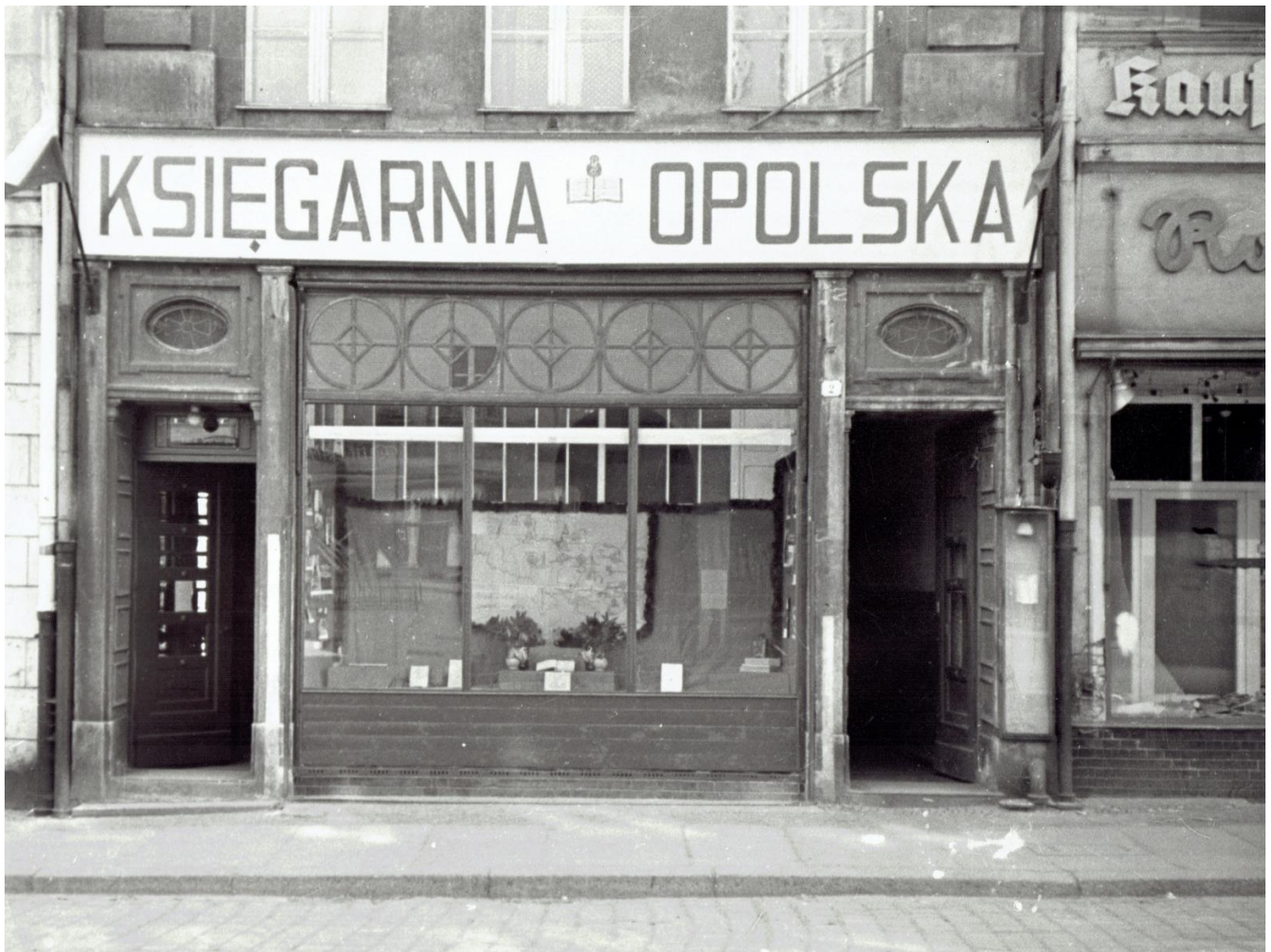
Księgarnia Opolska, Rynek 2 ok. 1946 roku