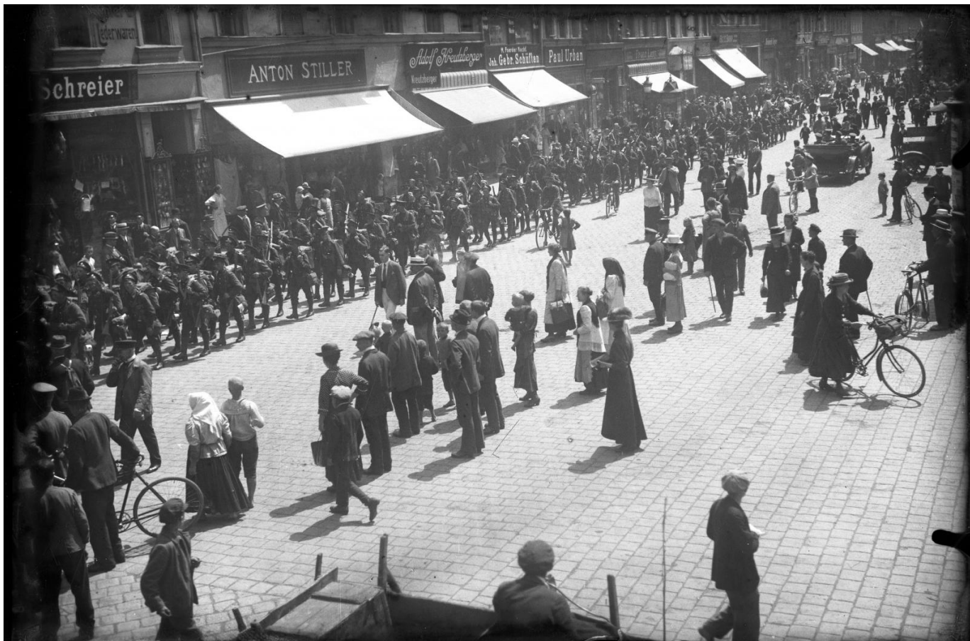
Przemarsz wojsk i uroczystości na rynku w okresie plebiscytowym, ok. 1921 roku