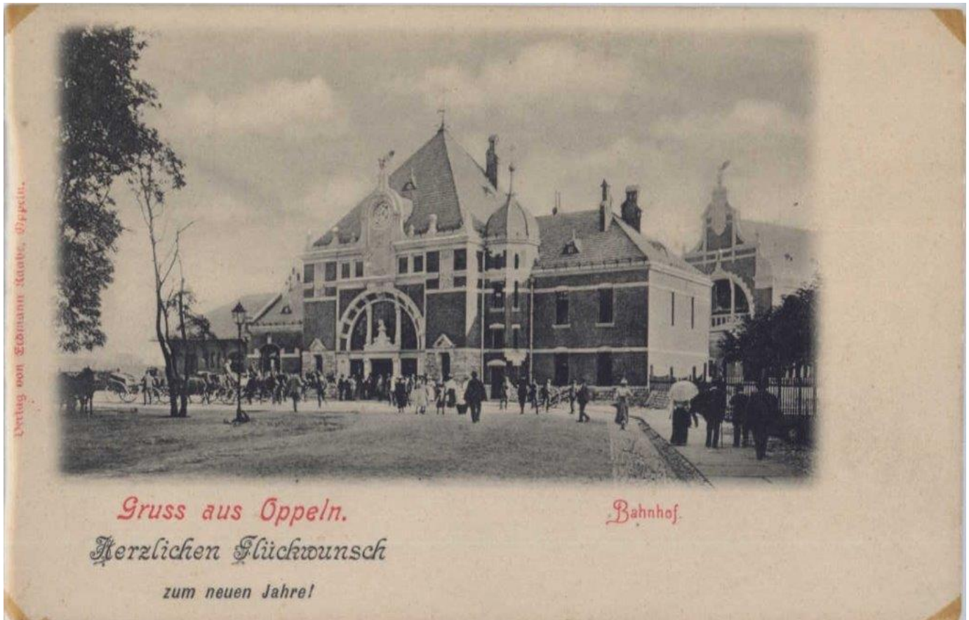
Nowy gmach dworca, karta pocztowa, wyd. E. Raabe, opole, 1899 rok.

podziemne wraz z budynkiem, w którym obecnie znajduje się hol wejściowy. Nowy budynek nawiązywał do głównego gmachu dworca. Jego fasadę zdobiły reliefy herbów Śląska, Opola oraz godło państwa niemieckiego. Przez lata zmieniał się także wygląd peronów. Przejście podziemne łączące główny peron z peronem drugim zbudowano na początku XX wieku.