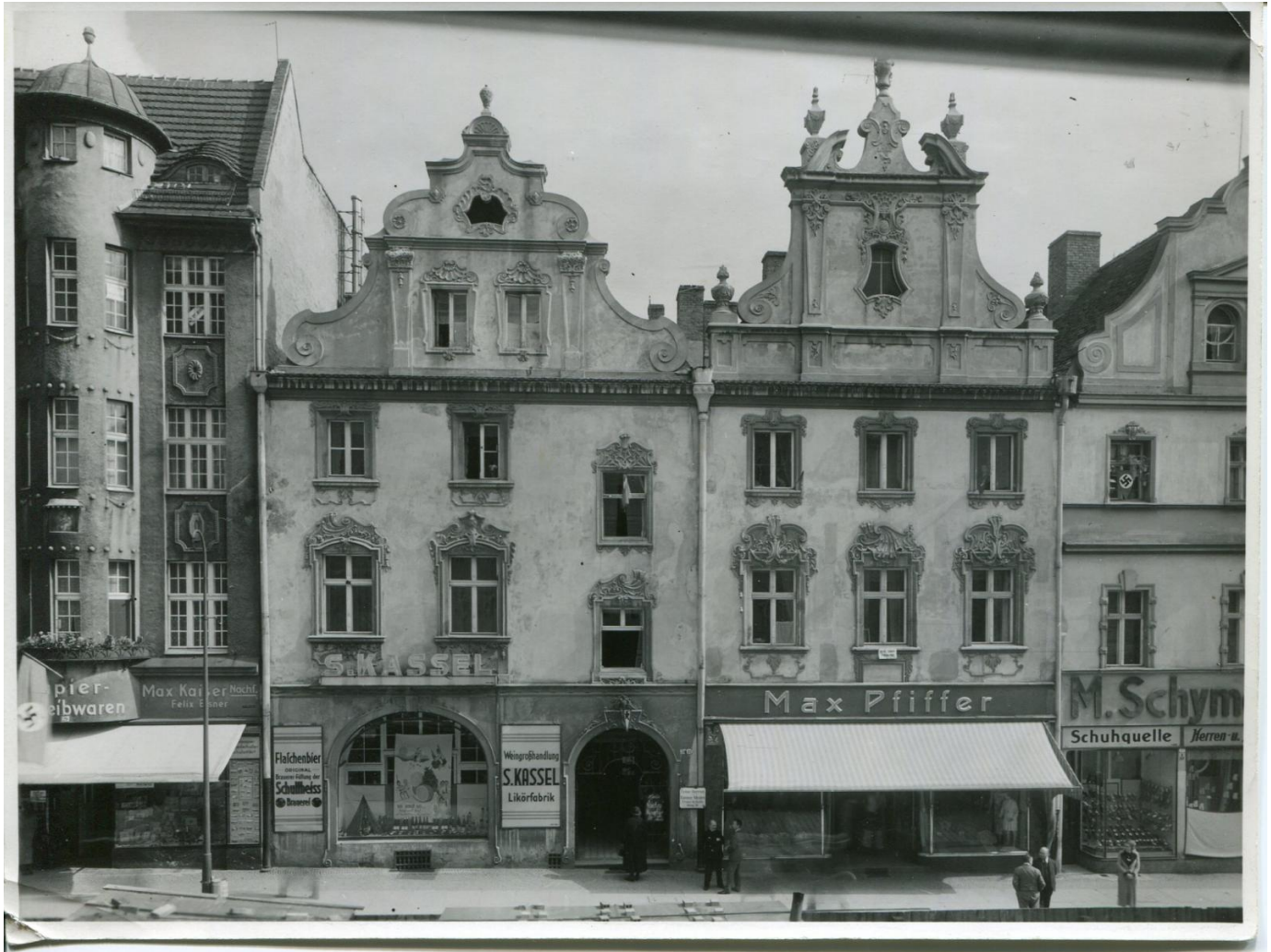
Południowa pierzeja rynku, lata 30. XX wieku