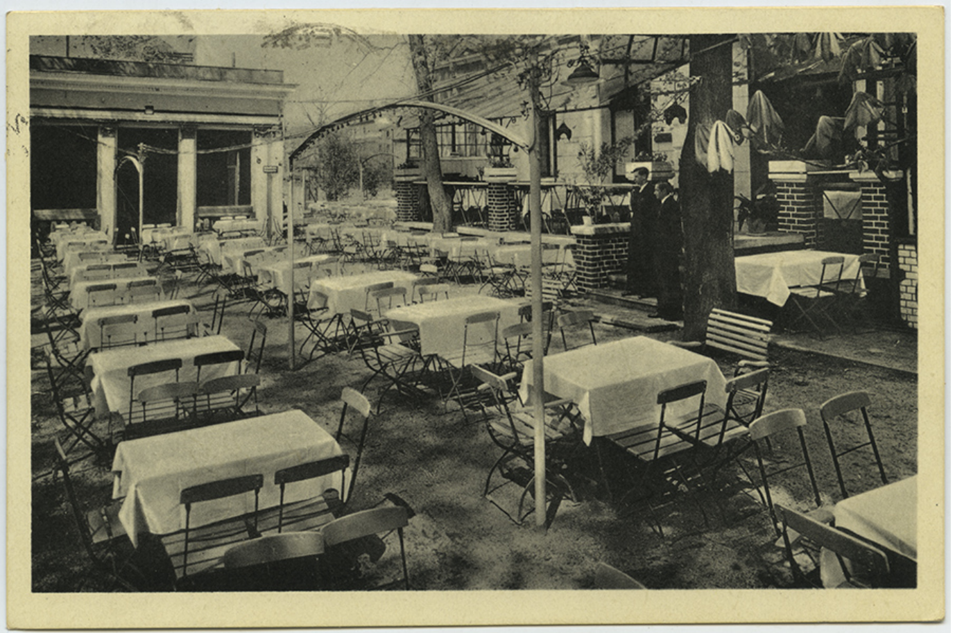
Restauracja „Eiskeller” przy ulicy Piastowskiej 17 ( ob. w tym miejscu mieści się Instytut Śląski).