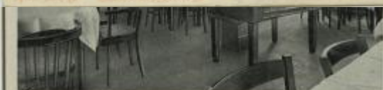
Gaststätte „Odermühle“ Inh. W. Klose - Oppeln, O.-S.