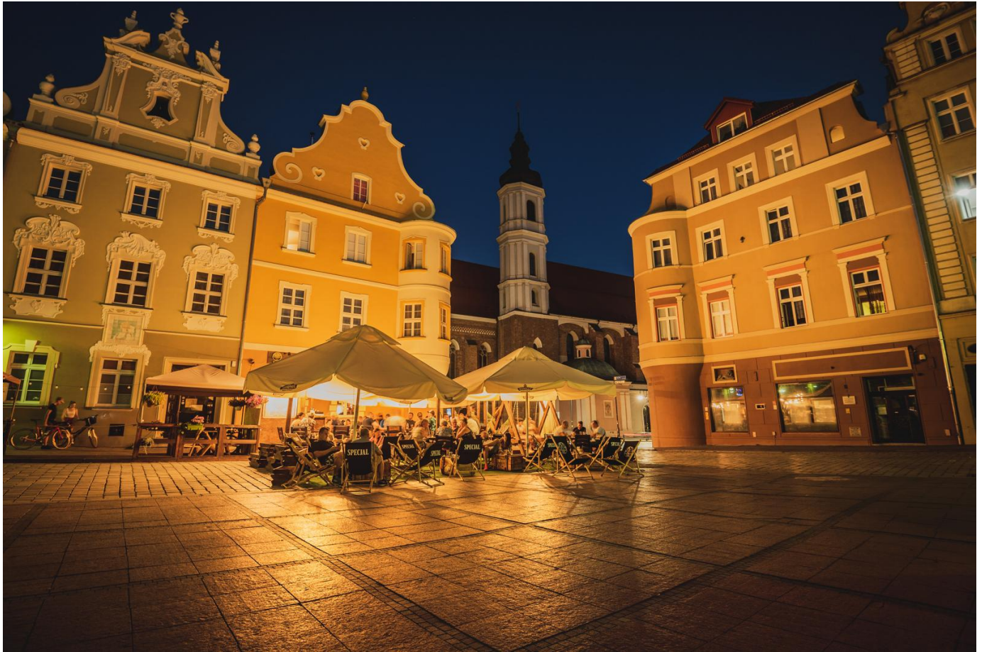
5. To nie Hogwart. To stacja Opole Główne.