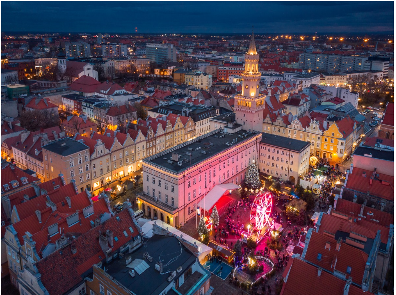
10. Piękne wnętrze Kaplicy Piastowskiej w Kościele Franciszkanów.