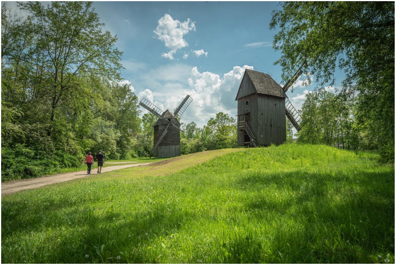
7. Górka w Parku na Osiedlu Armii Krajowej jak schody do nieba.