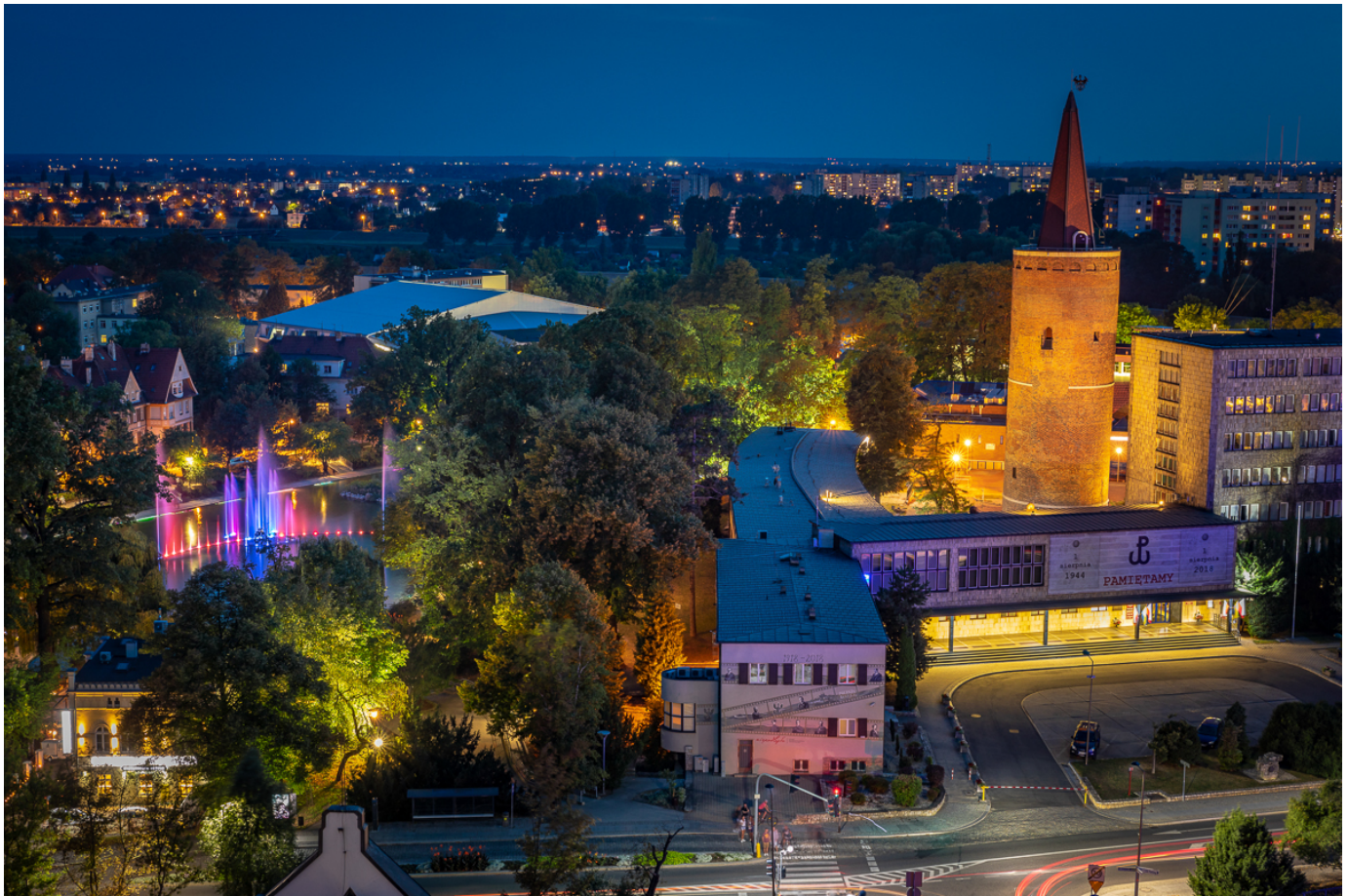
14. Wędrowną pasiekę na dachu jednej z kamienic Starego Miasta.