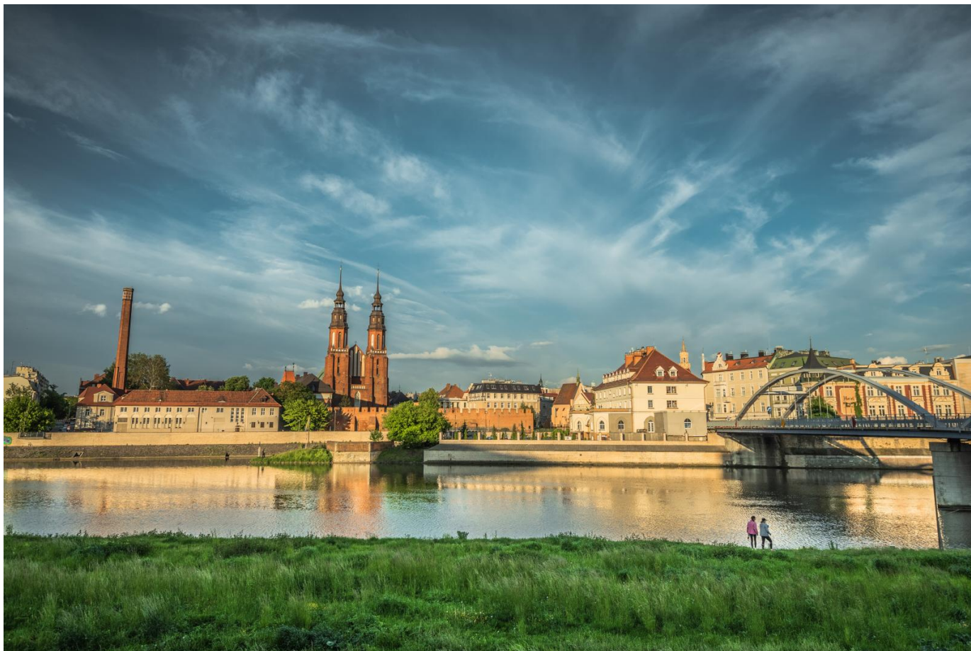
4. Ciepły, letni wieczór najlepiej spędzić na opolskim Ryнку.