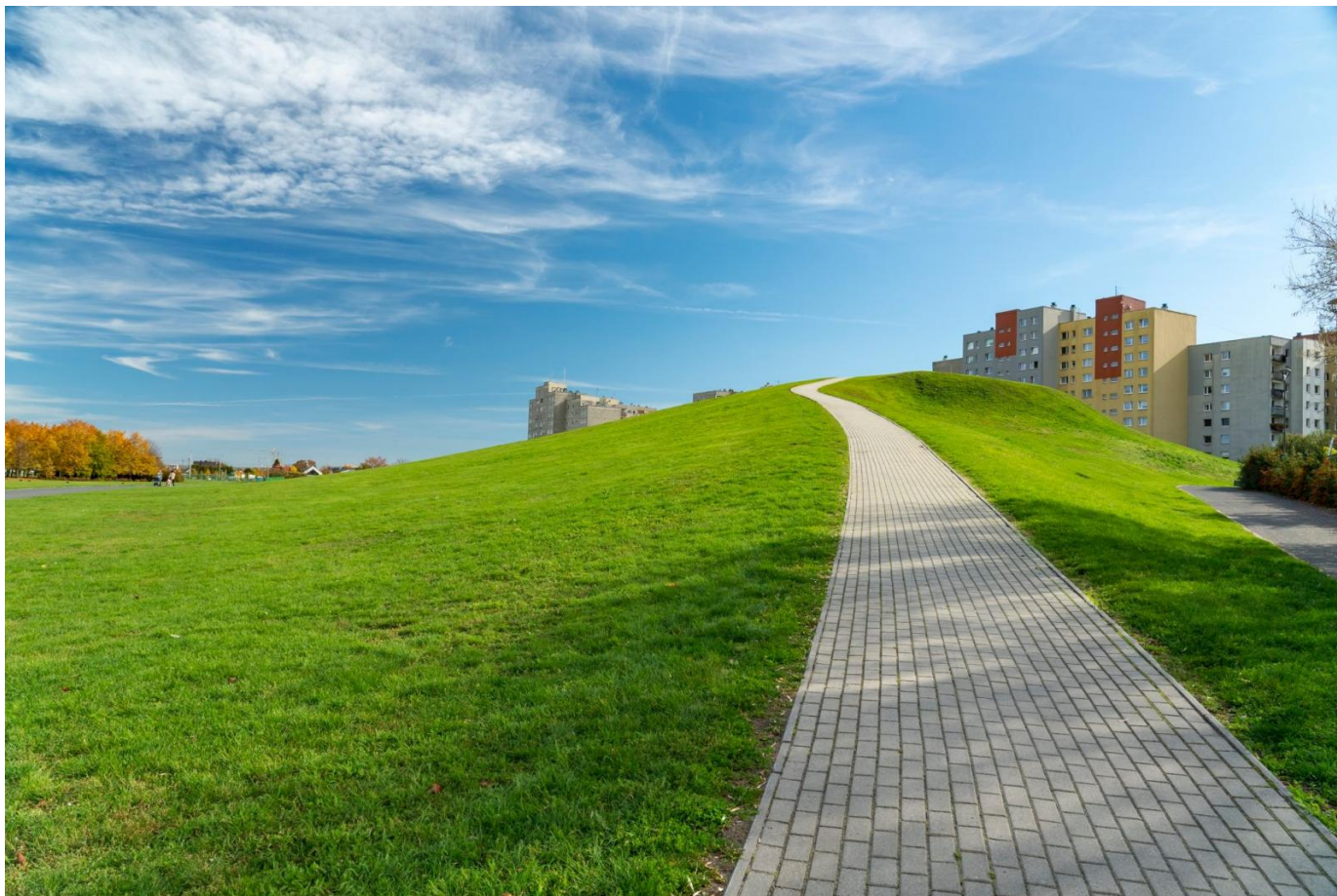
8. Malownicze Opole w trakcie Krajowego Festiwalu Polskiej Piosenki.