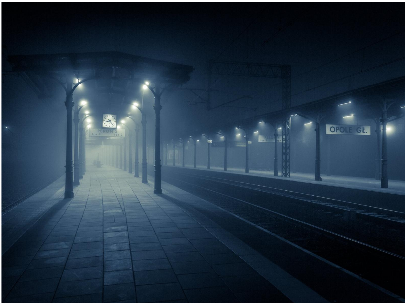
6. Sielankowy nastrój Muzeum Wsi Opolskiej.