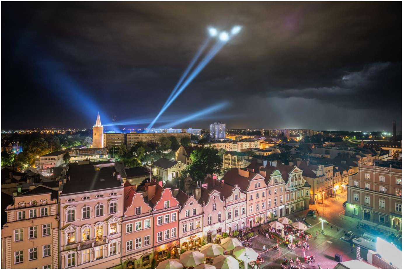
9. Przypadł wam do gustu Rynek w trakcie Jarmarku Bożonarodzeniowego.