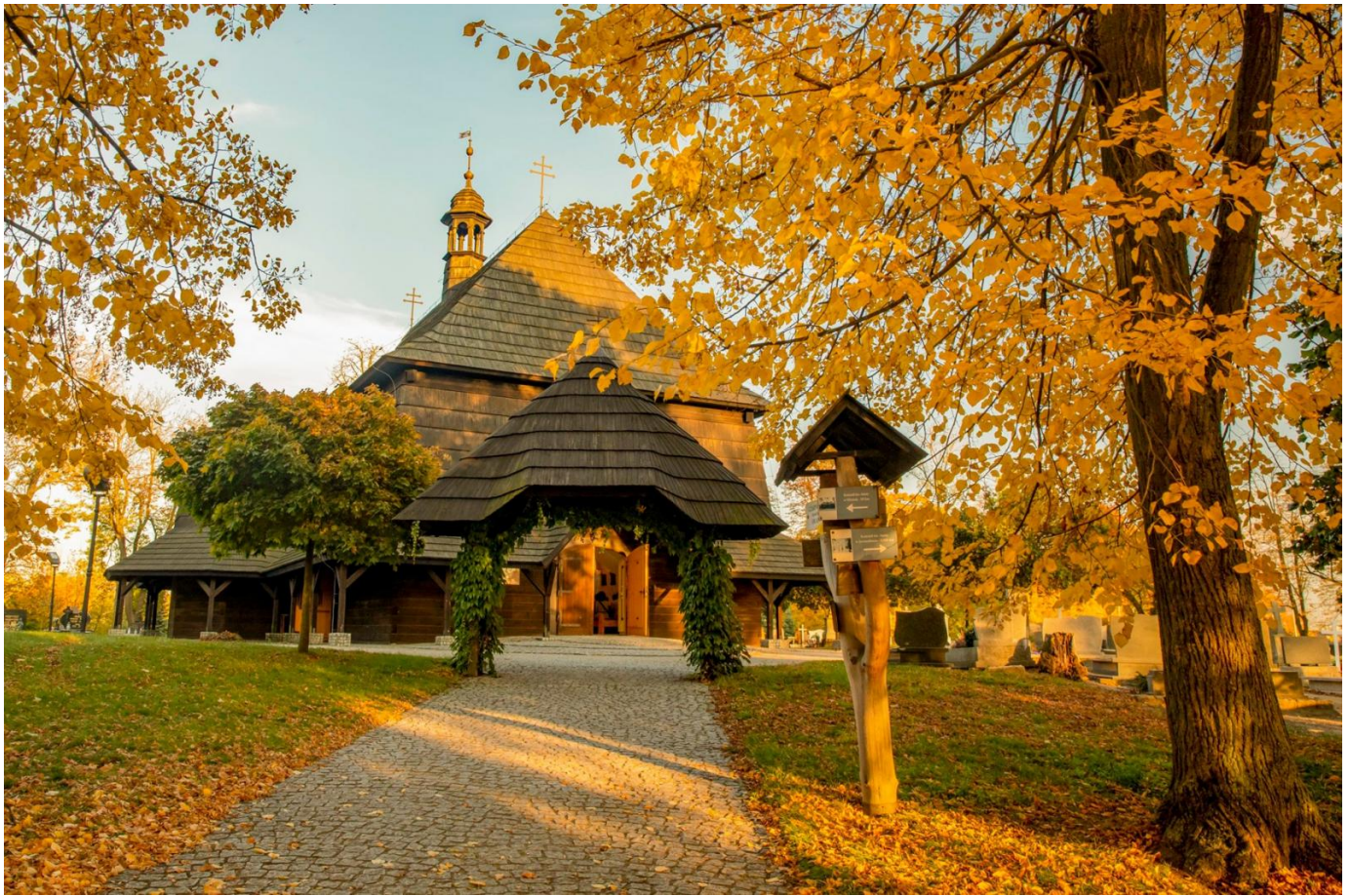
18. Południowa pierzeja Rynku w pełnej krasie.