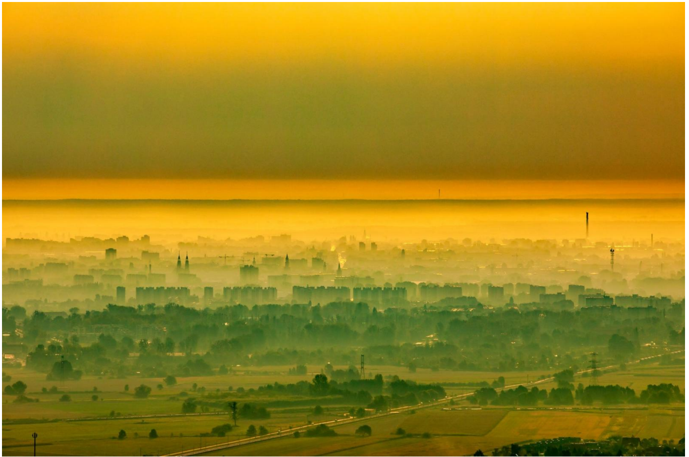
13. Piękny widok w stronę Wieży Piastowskiej oraz Stawku Zamkowego.