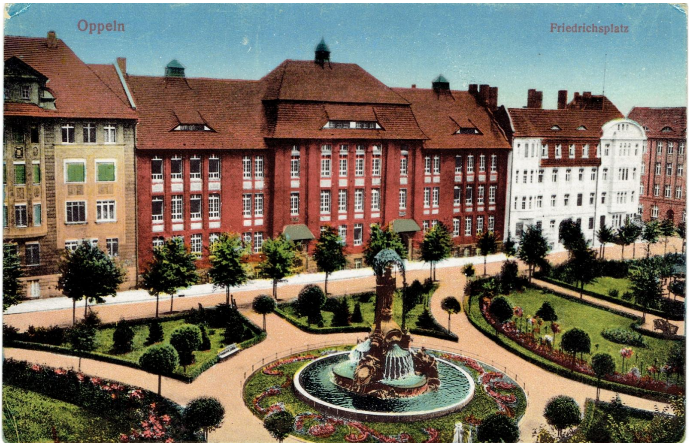
Plac I. Daszyńskiego, karta pocztowa, wyd. B. Scholz, Wrocław, ok. 1910 r.

Na szczycie fontanny, na kwiatowym impoście znajduje się postać kobieca z dzieckiem na ręku, bogini Ceres, przed wojną osłonięta ażurowym baldachimem. U jej stóp umieszczono postaci nawiązujące do głównych branż opolskiego przemysłu. Są tu dwie kobiety ze snopkami zboża i owocami, symbolizujące rolnictwo; mężczyzna z sieciami, symbolizujący rybołówstwo oraz górnik z kilofem, nawiązujący do przemysłu cementowego, którym Opole stało w XIX i XX w.