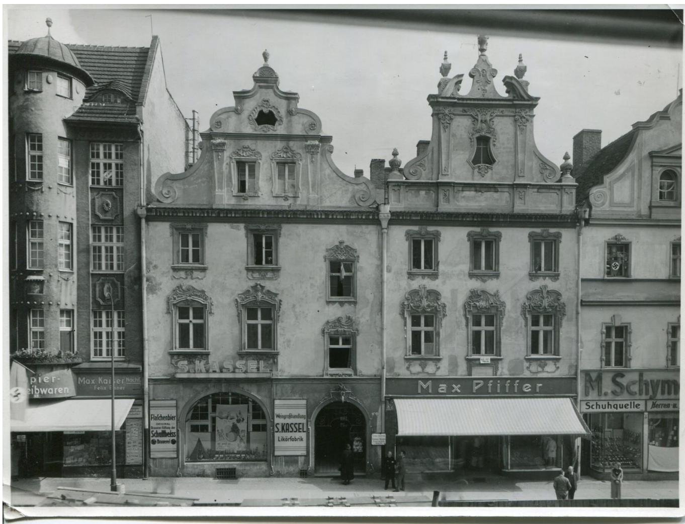
Południowa pierzeja rynku, lata 30. XX wieku