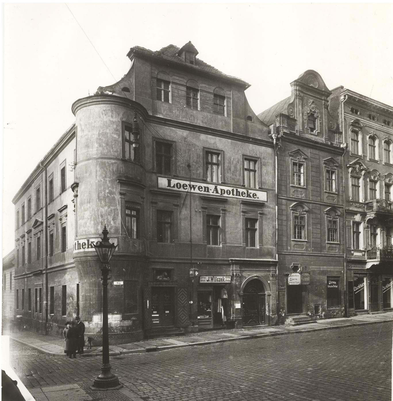
Rynek 1-3. W budynku nr 1 od ok. 1824 roku mieściła się apteka „Pod Lwem”, 1912 rok