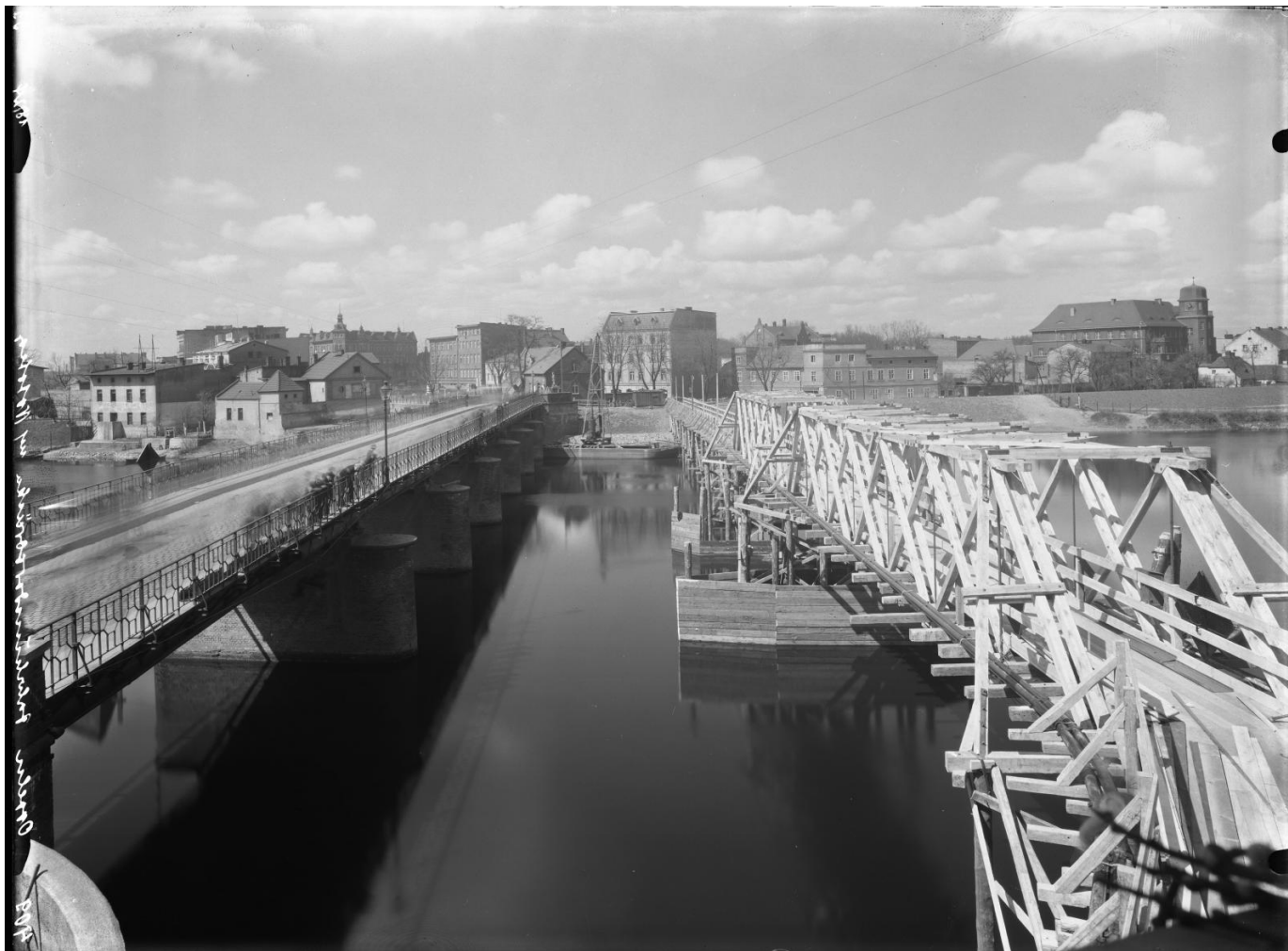
Most Stulecia w trakcie kapitalnego remontu, ok. 1932 roku