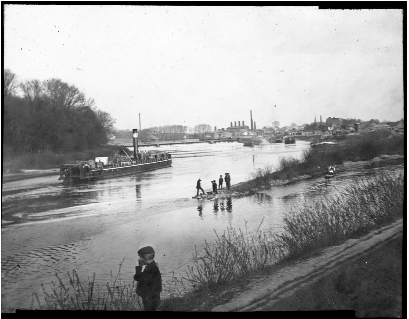
Kanał śluzowy, widok w kierunku Zakrzowa, lata 20./30. XX wieku