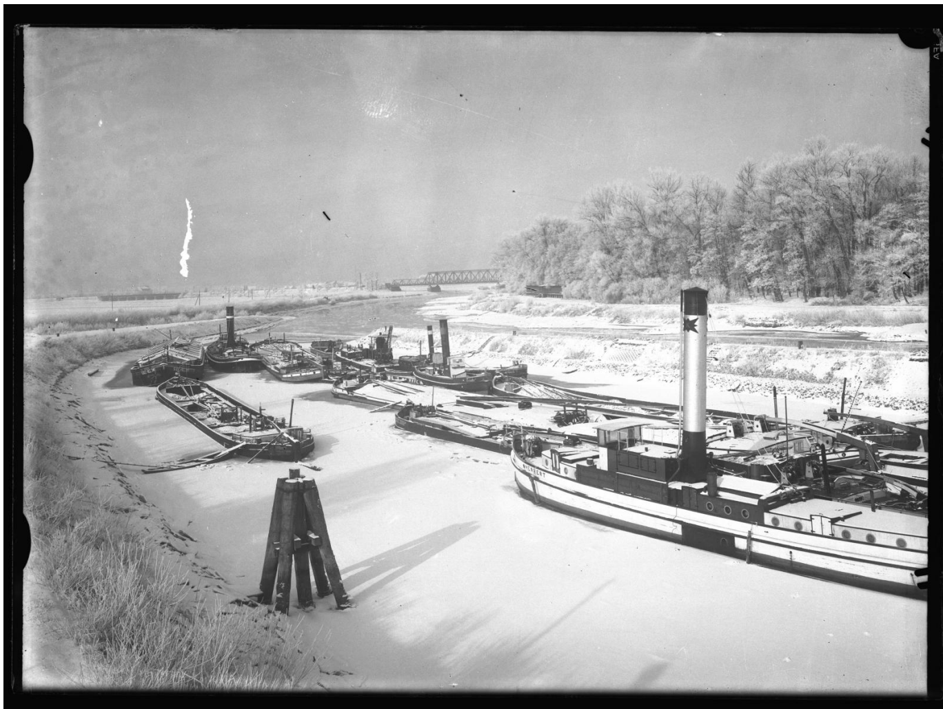
Odra skuta lodem, lata 20. XX wieku