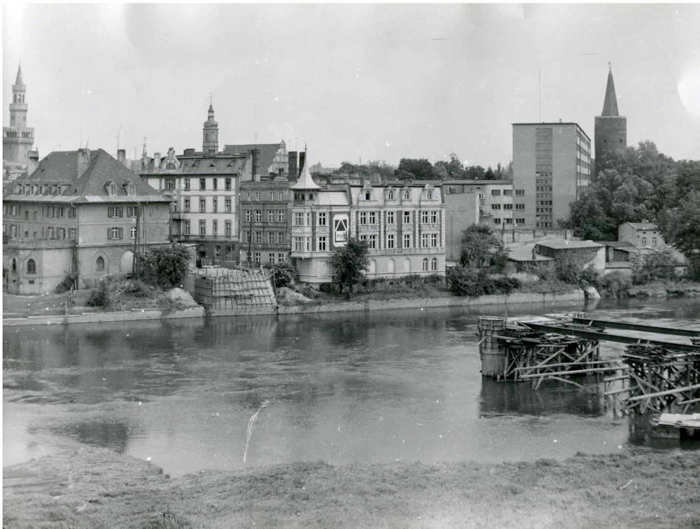
Zniszczony most na Odrze, ok. 1945 roku