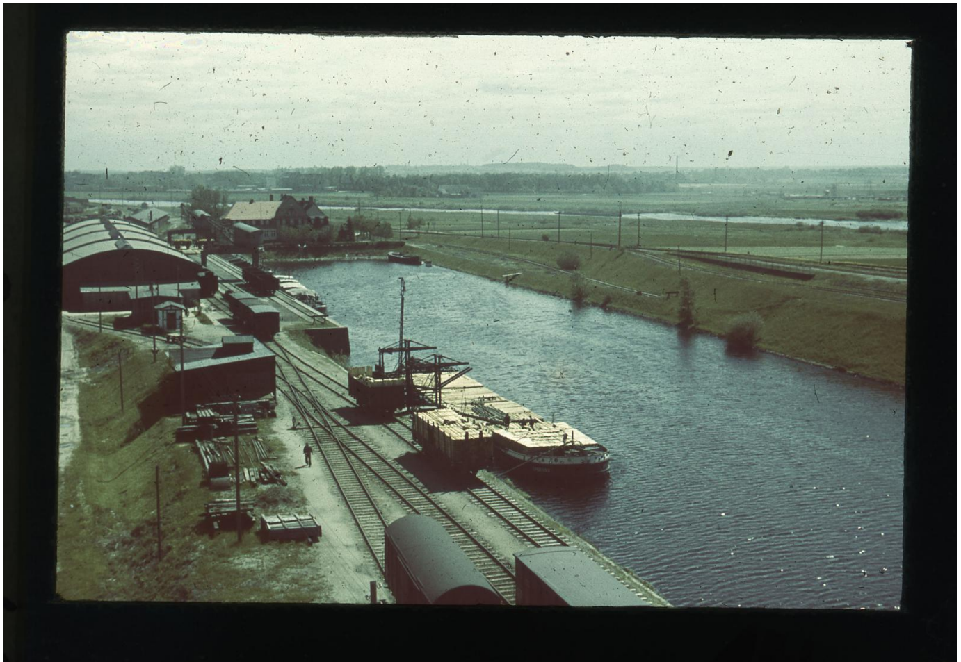
Port w Zakrzowie, lata 30. XX wieku