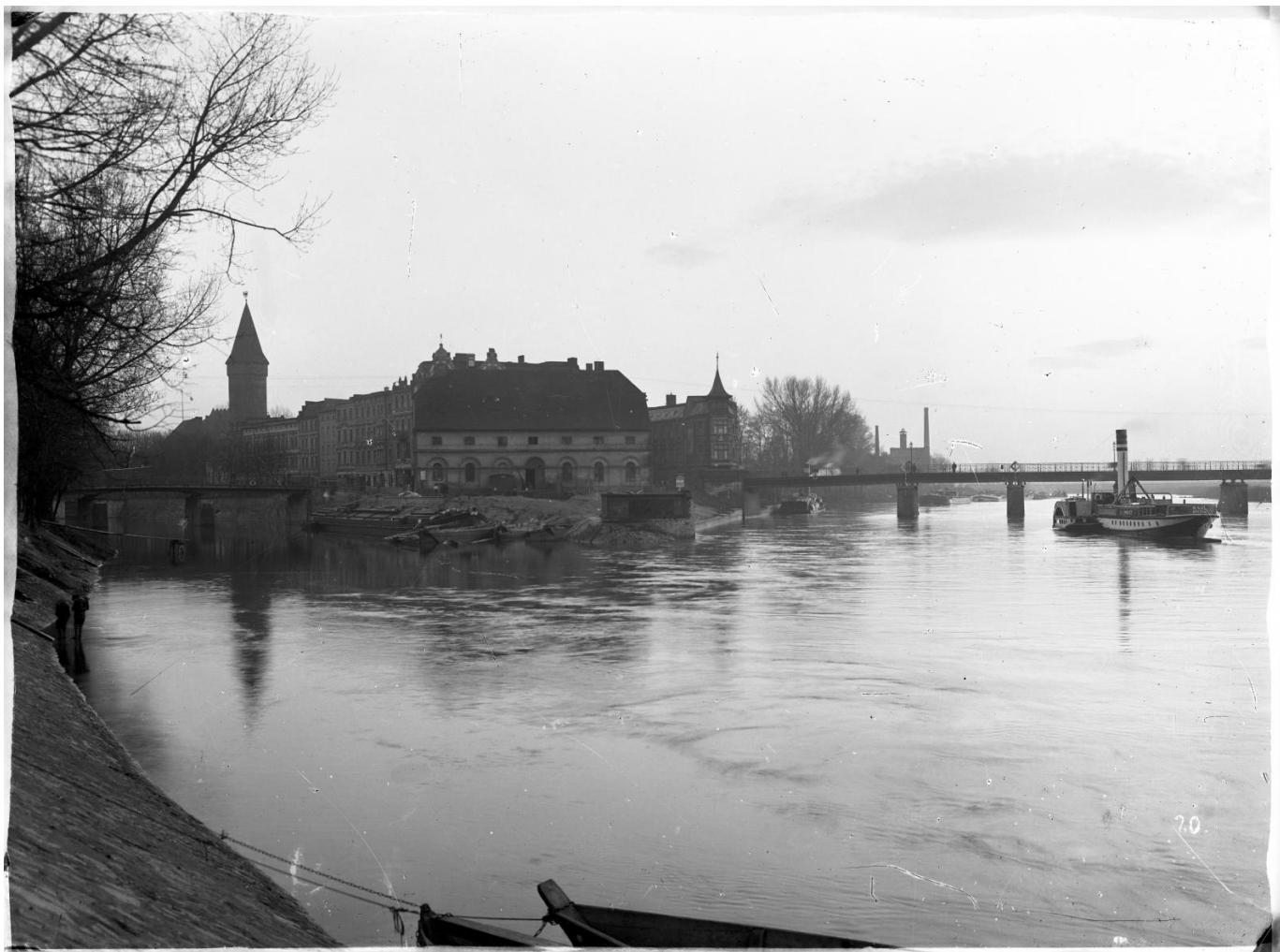
Widok na Ostrówek z prawego brzegu Odry, lata 20. XX wieku