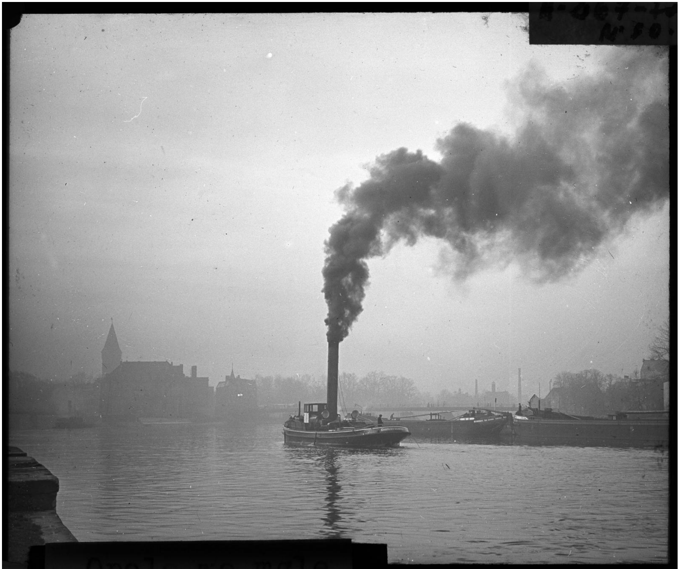
Lata 20. XX wieku