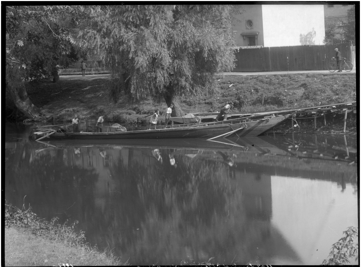
Piaskarze nad Odrą, 1927 rok