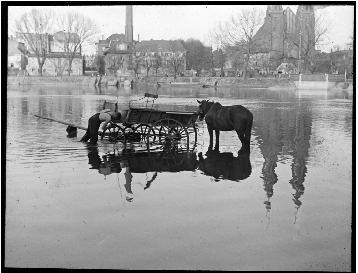
Miejsce mycia powozów nad Odrą, lata 20. XX wieku