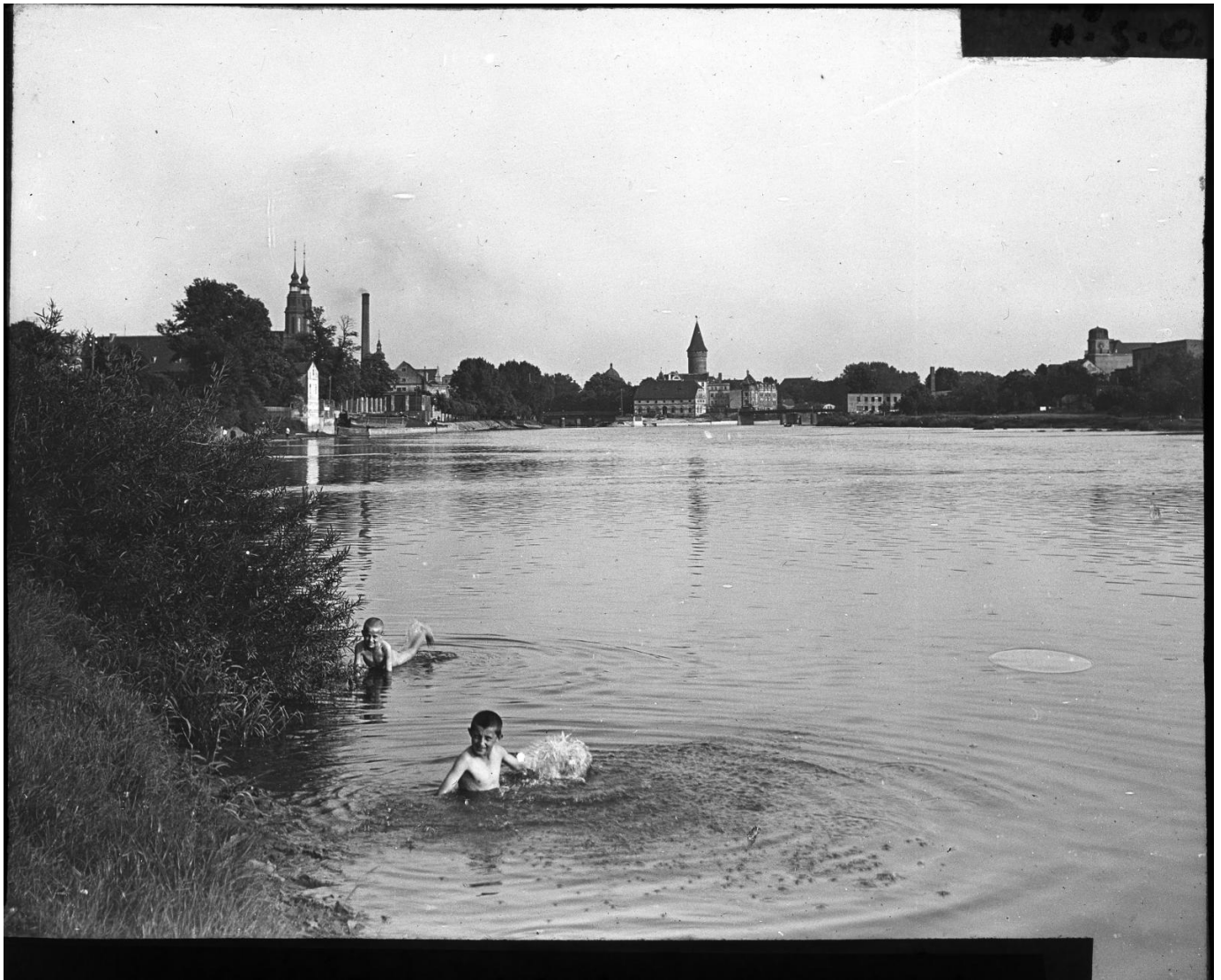
Odra, ok. 1930 roku