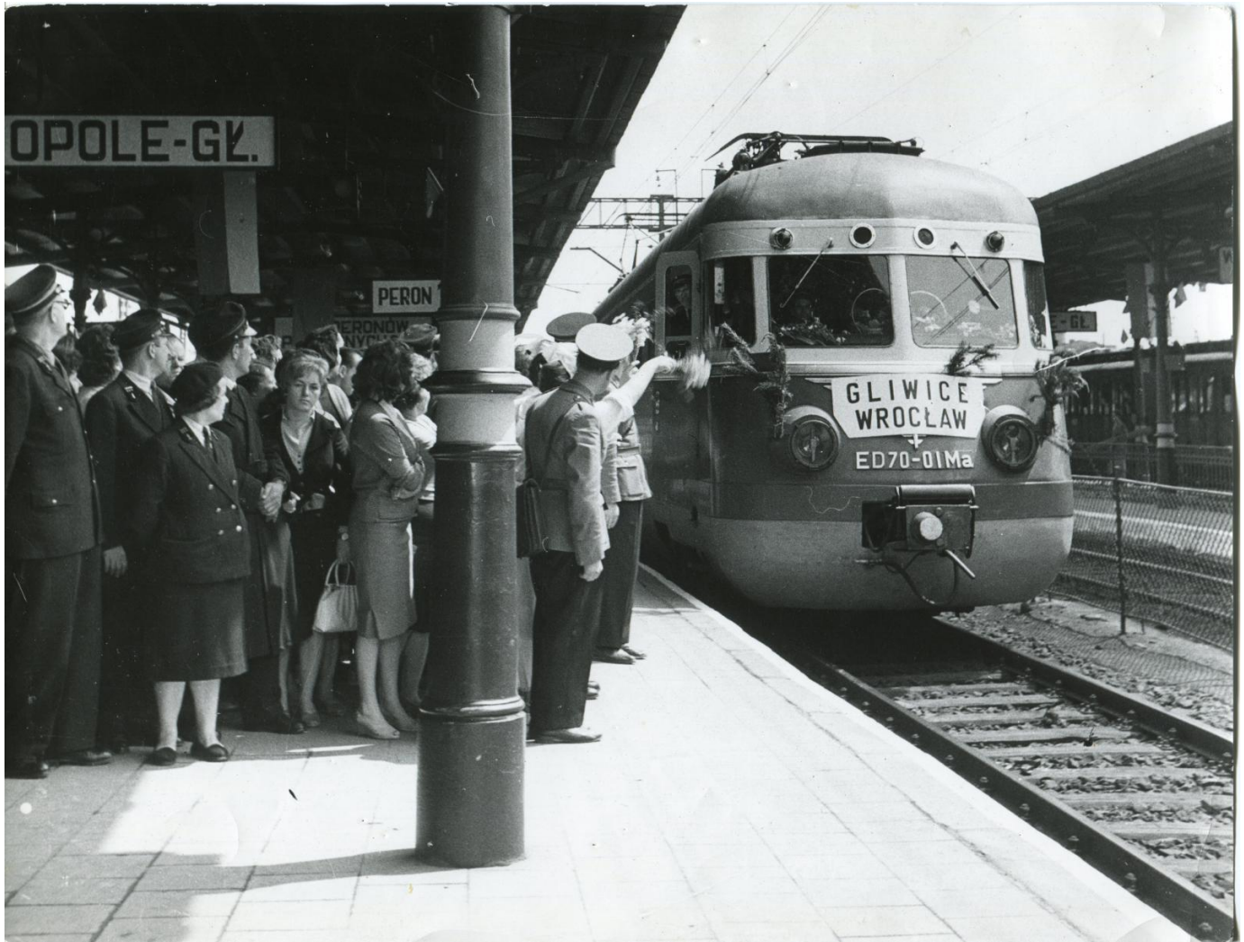
Peron dworca w latach 60. XX wieku