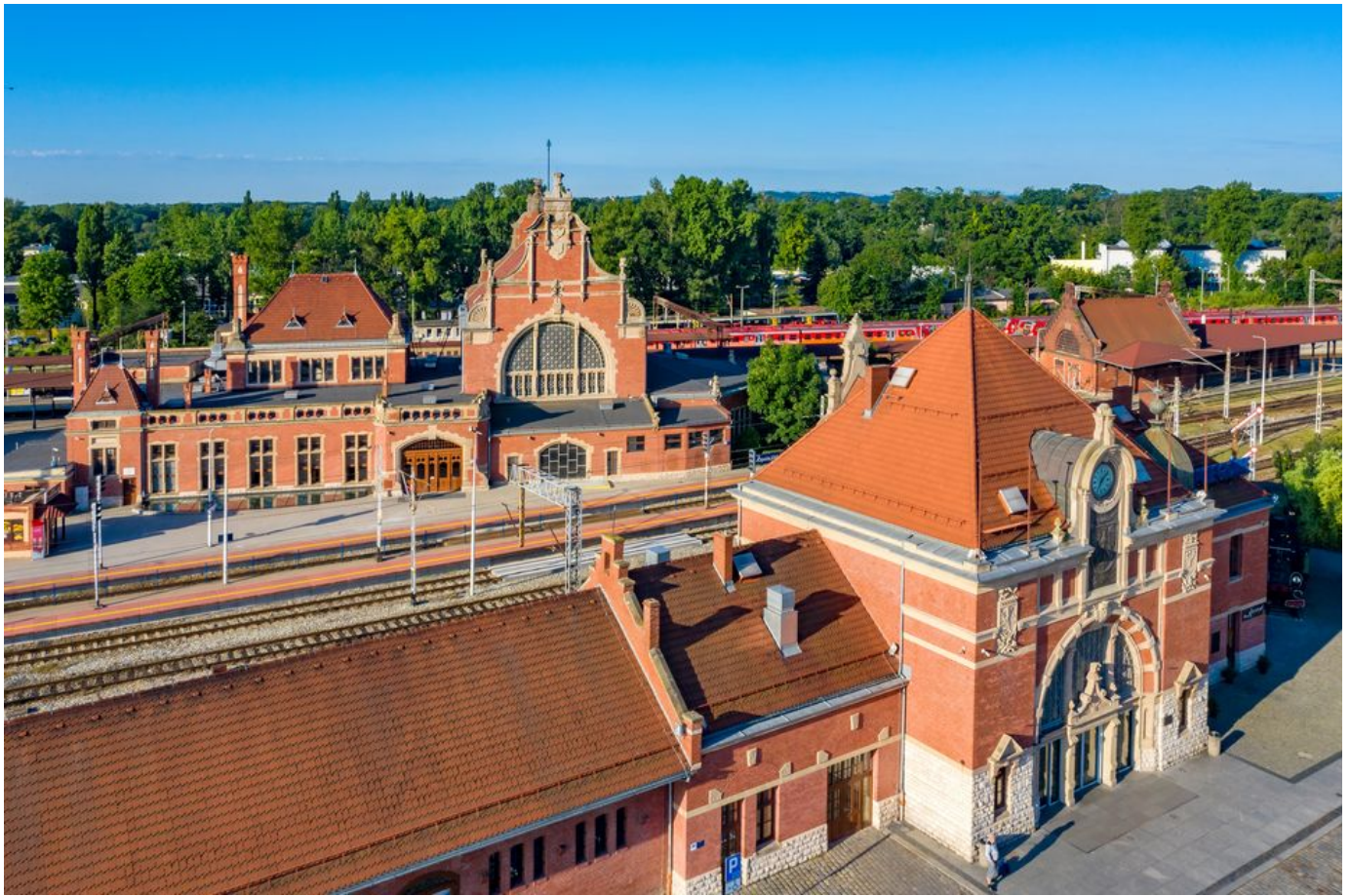
Dworzec Główny obecnie