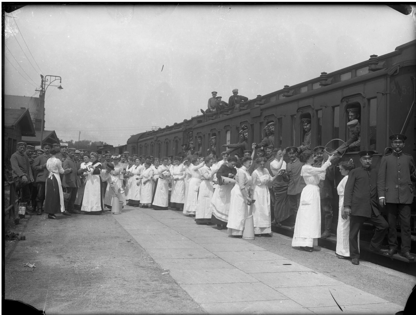
Peron dworca w czasie I wojny światowej. Kobiety z Czerwonego Krzyża rozdają żywność, około 1915 roku.