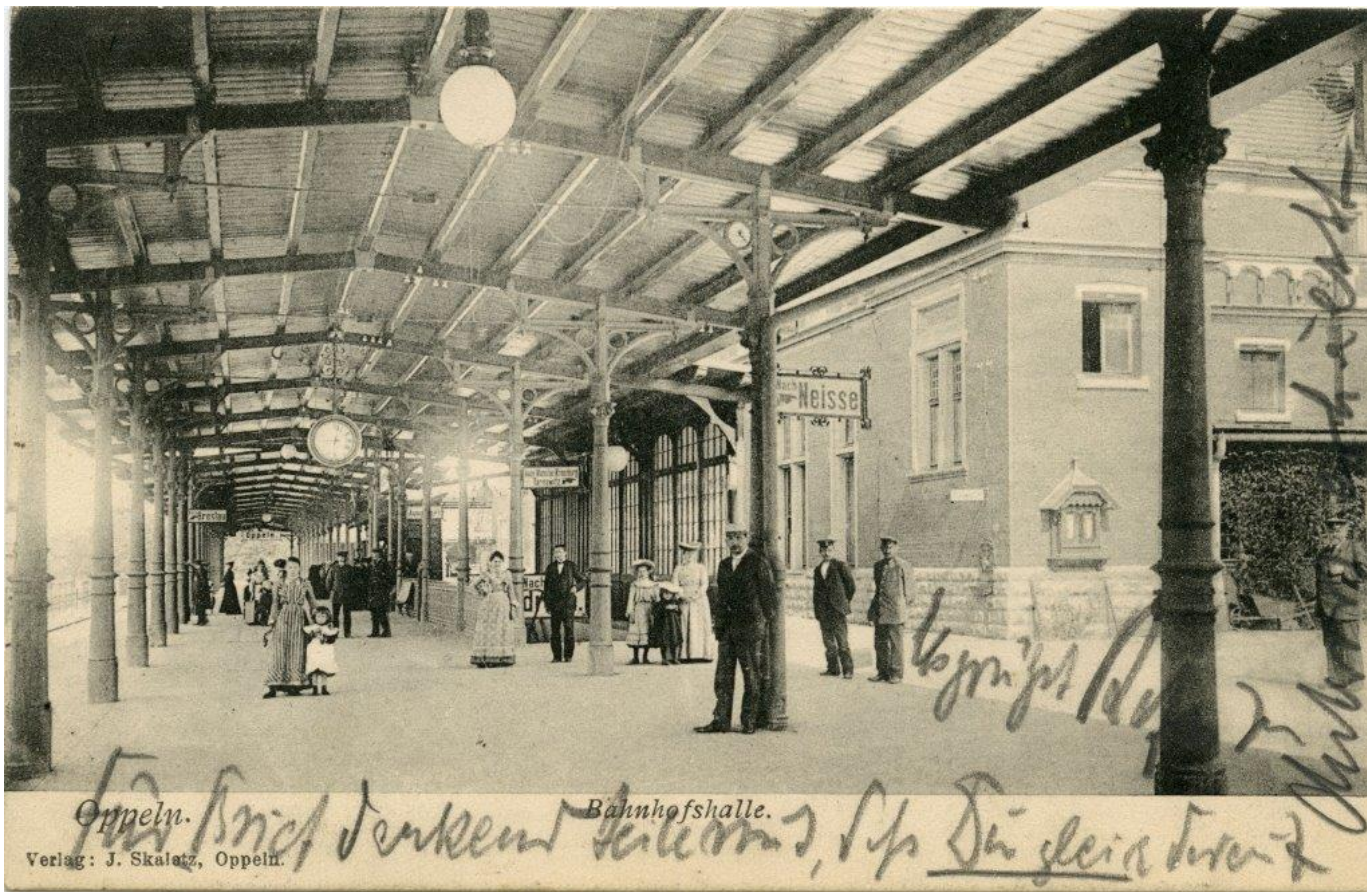
Peron dworca głównego na przełomie wieków, karta pocztowa, wyd. J. Skaletz, Opole, około 1900 roku.