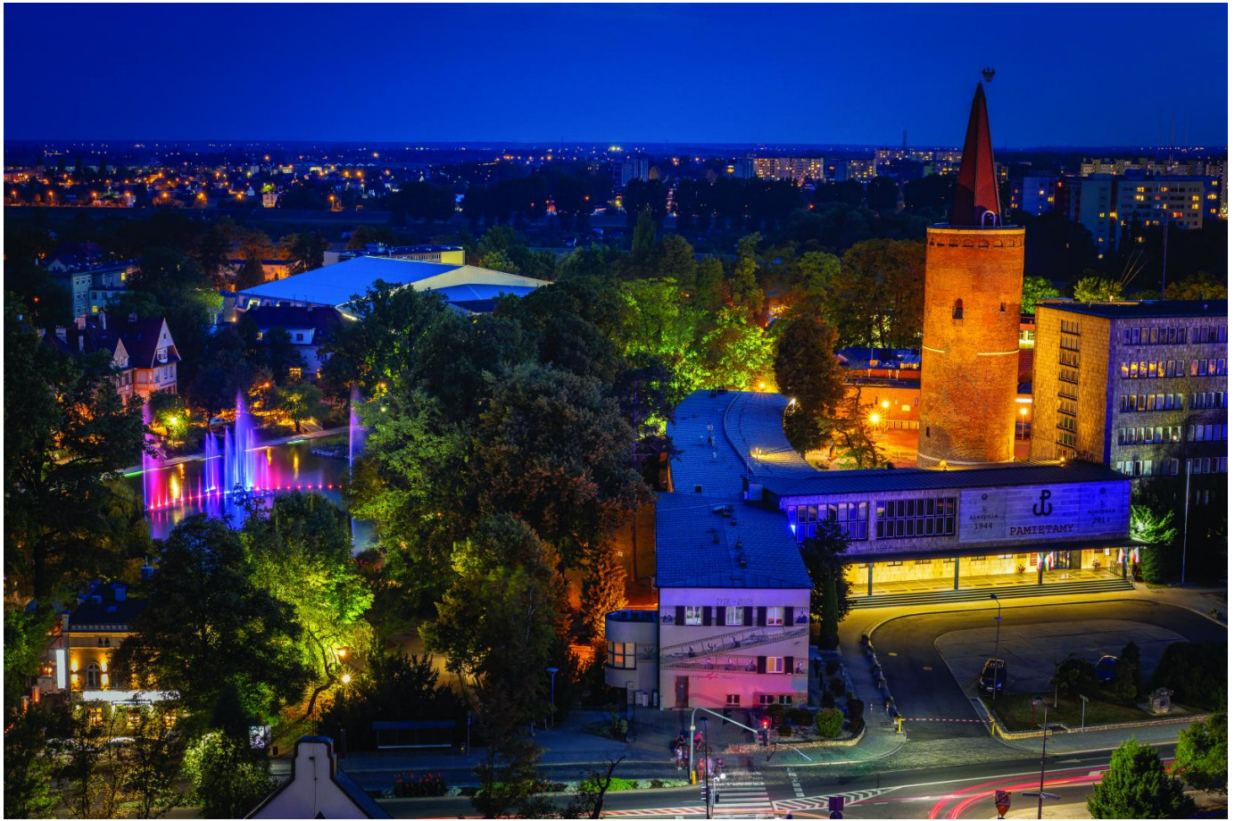
Wieża Piastowska obecnie, fot. P. Uchorczak