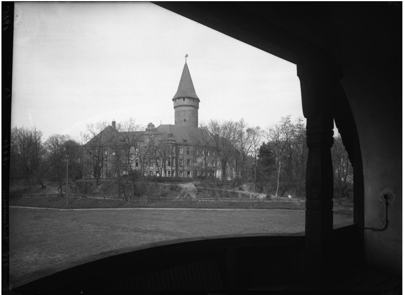
Widok od strony stawu zamkowego, lata 20. XX wieku.