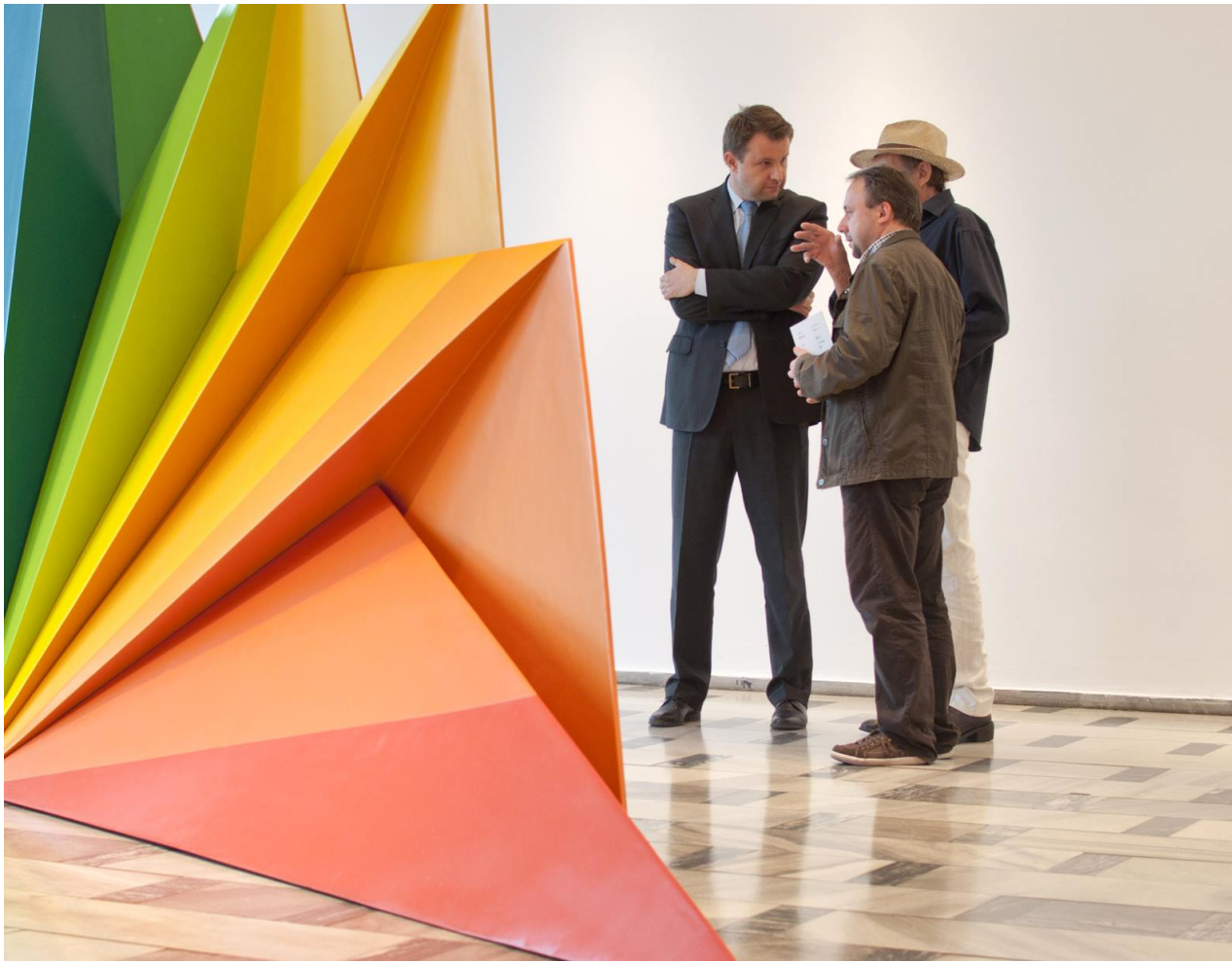
Wernisaż w GSW, 25.05.2016 rok.