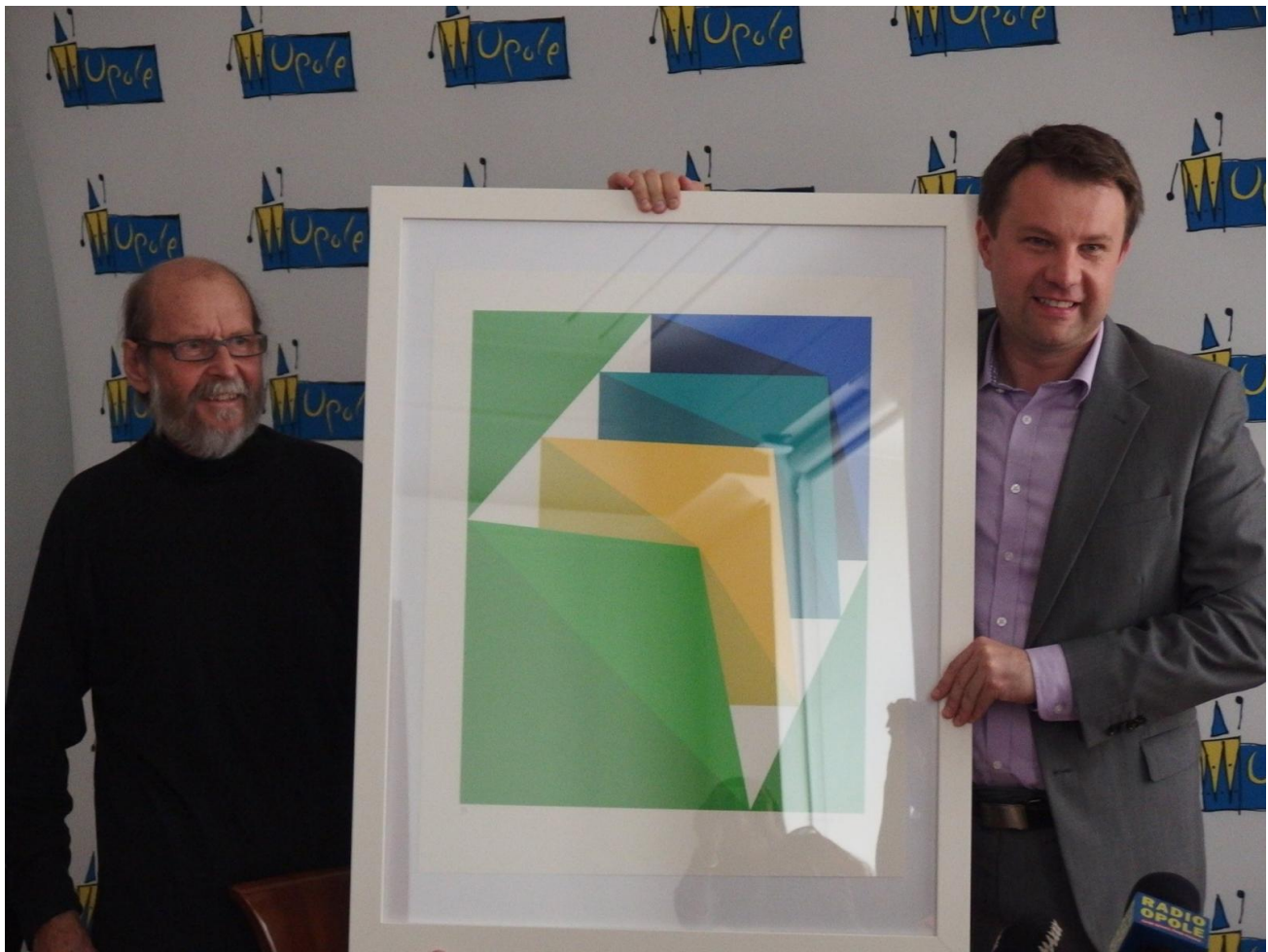
Konferencja prasowa w ratuszu, 24.05.2016 rok.