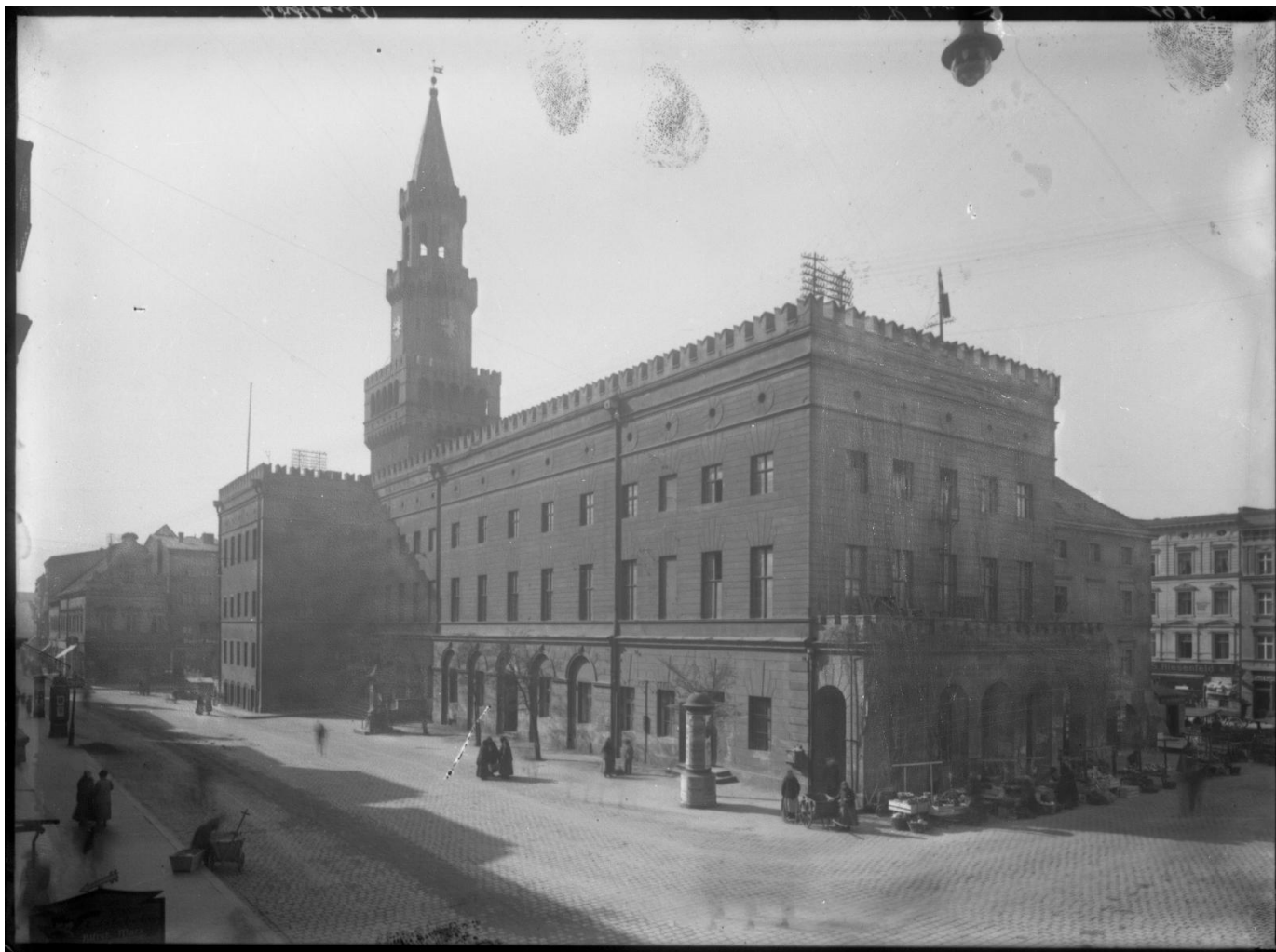
Widok od strony północno-wschodniej, ok. 1916 r.