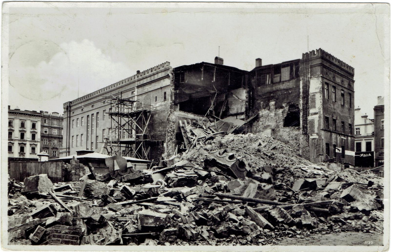
Ratusz po katastrofie budowlanej 15 lipca 1934 r., karta pocztowa, wyd. P. Kowol, Opole, 1934 r.