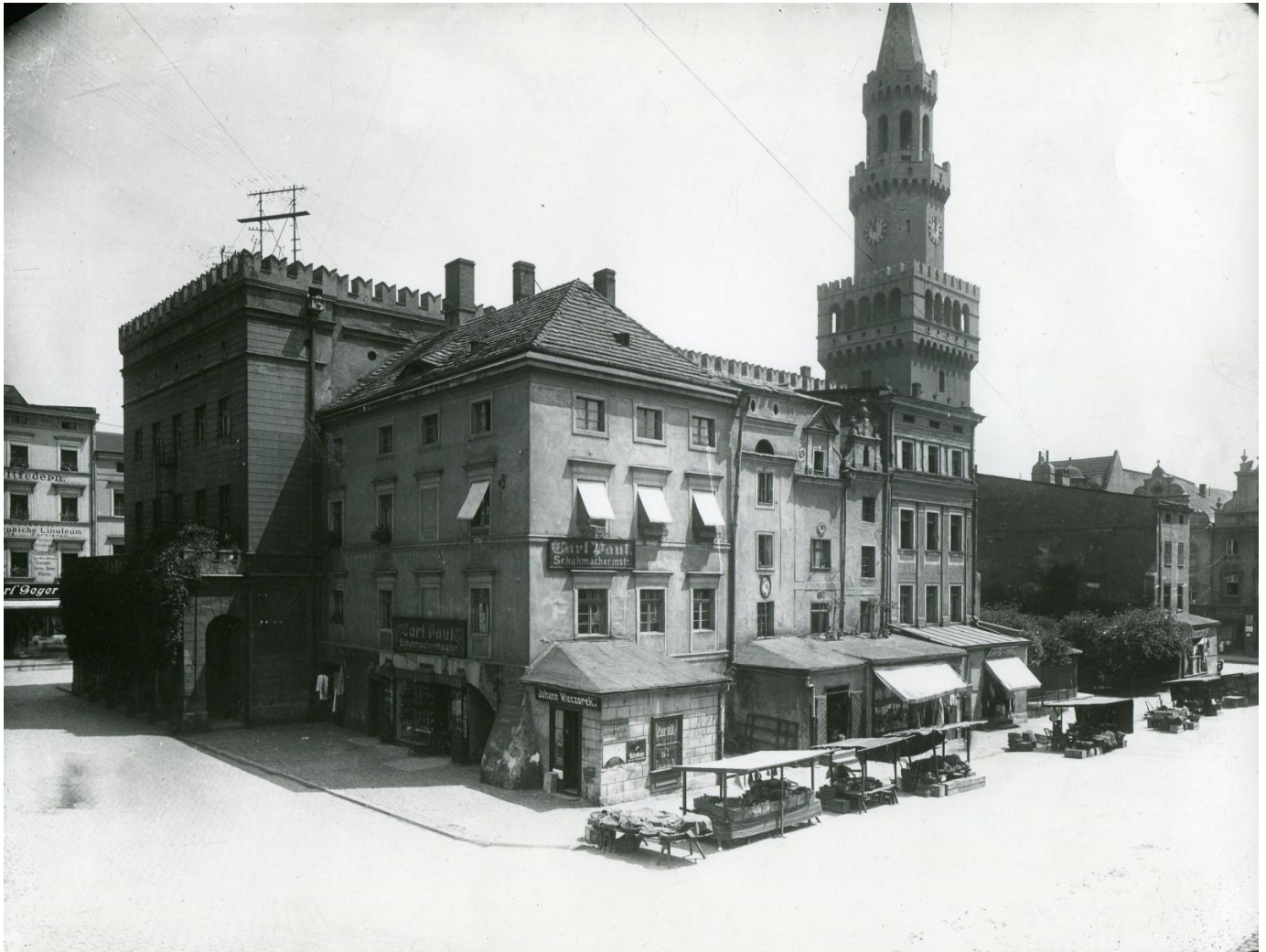
Ratusz i kamienice śródrynkowe, widok z budynku znajdującego się na rogu ul. Młyńskiej i B. Koraszewskiego, ok. 1916 r.