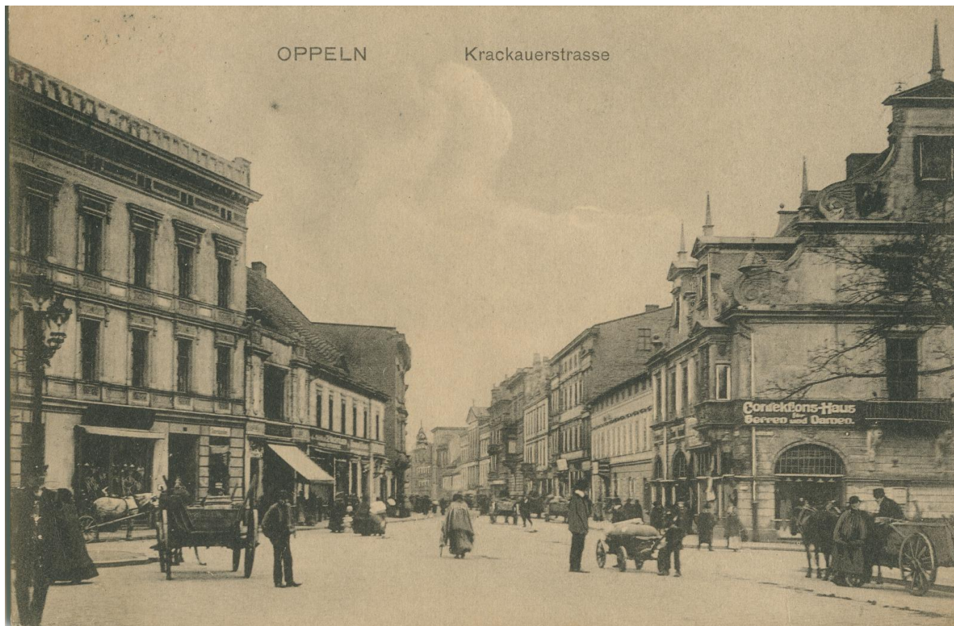
Zabudowa ulicy Krakowskiej, widok w stronę dworca, karta pocztowa, wyd. Rheinische Kunstverlagsanstalt, Wiesbaden, ok. 1909 r.

sprzedawał wszystko po 95 fenigów za sztukę.