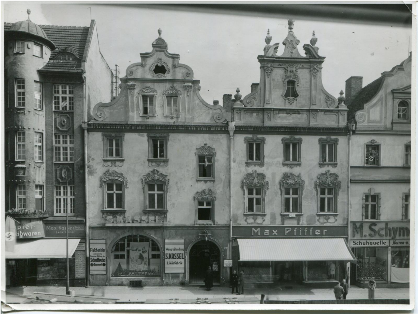
Południowa pierzeja rynku, lata 30. XX wieku