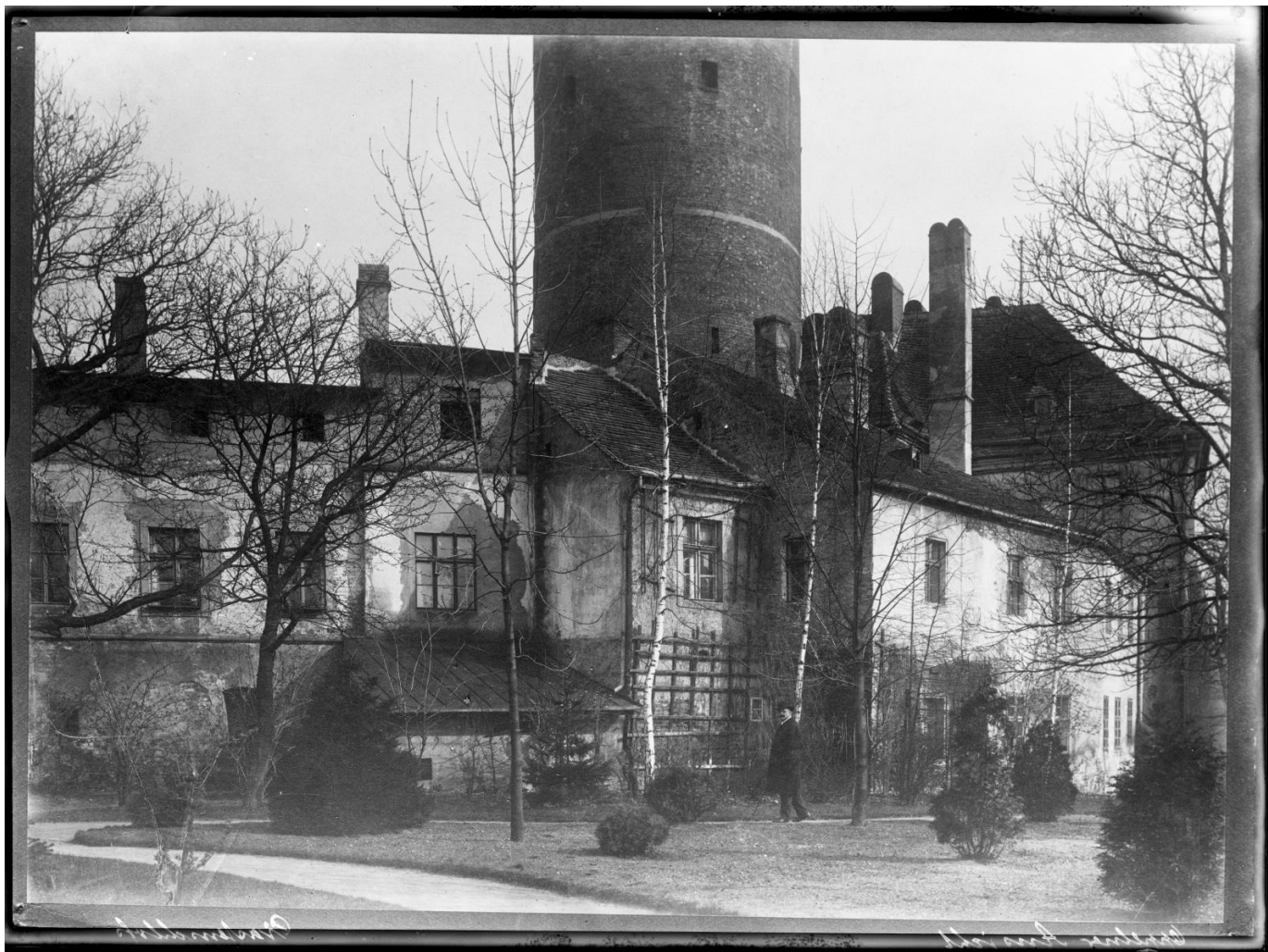
Zamek Piastowski w latach 20. XX wieku.