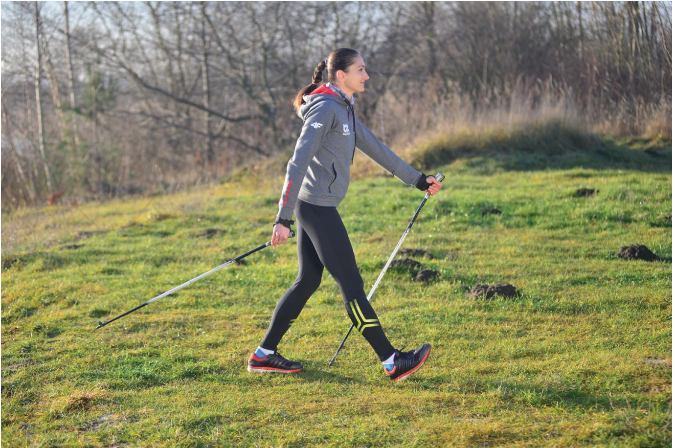
Krok pięta - palce

Wykonując krok stawiamy stopę począwszy od pięt przetaczając ją na palce. Idziemy długim krokiem wyciągając kije i akcentując marsz odepchnięciem się grota kija od podłoża. Przed rozpoczęciem marszu patrzymy przed siebie i ruszając delikatnie pochylamy ciało, nie wbijając oczu w ziemię (zginamy się w stawie biodrowym).