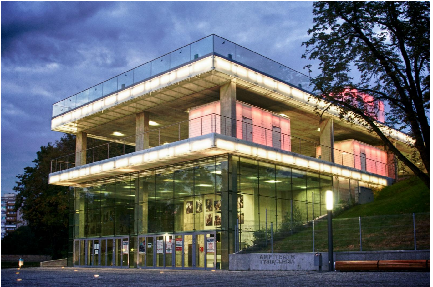
Wejście główne, widok współczesny.