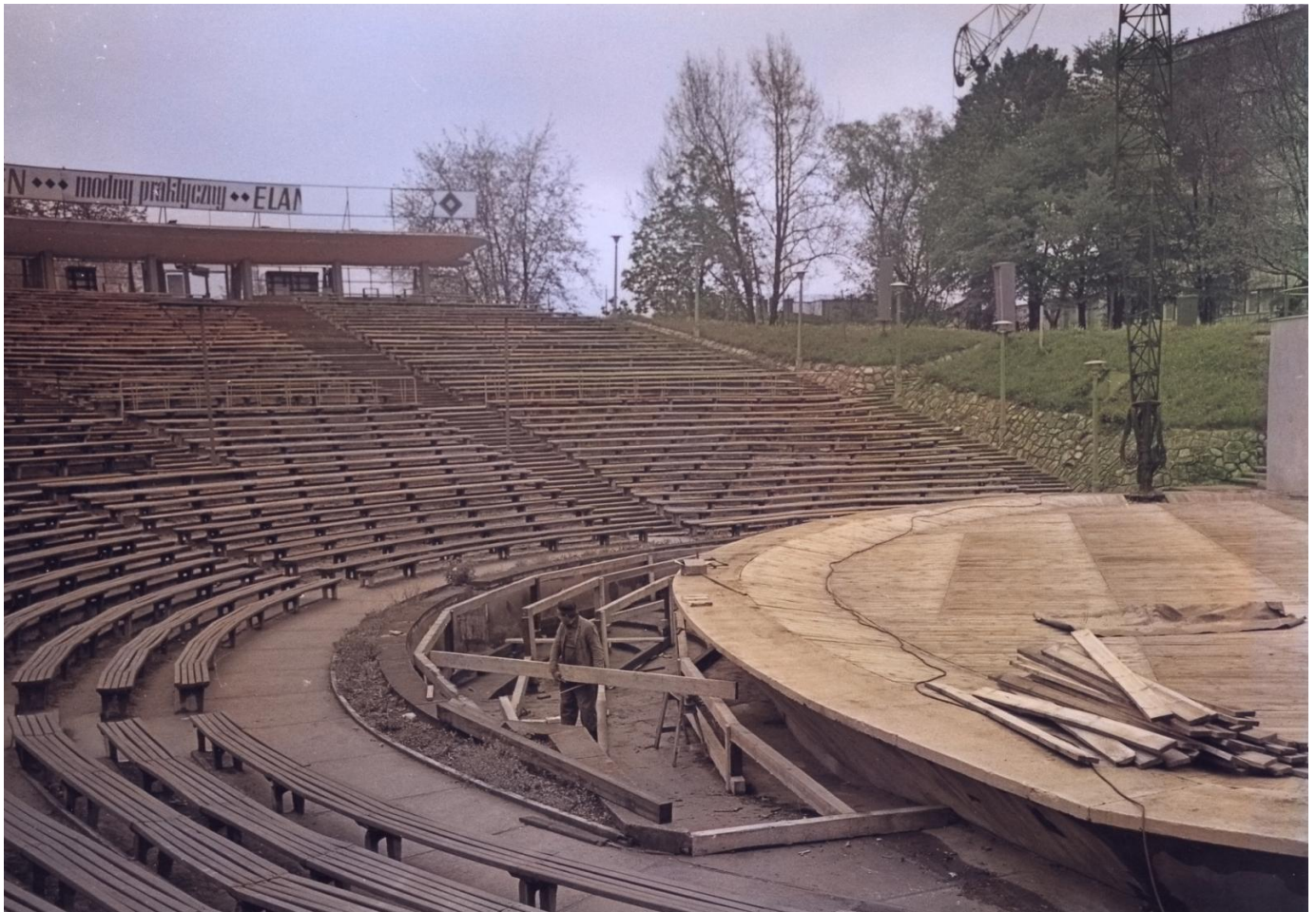
Prace budowlane