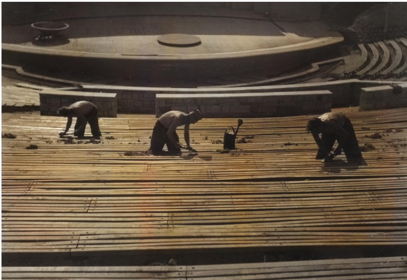
Prace budowlane

Amfiteatr uroczyście otwarto pierwszego dnia festiwalu - 19 czerwca 1963 r. Początkowo festiwale odbywały się w amfiteatrze bez muszli, dlatego pogoda dawała się we znaki: artyści śpiewali w ulewnym deszczu lub upale nie do wytrzymania. W historii najmocniej zapisał się II KFPP z 1964 roku. Wtedy w trakcie koncertu laureatów spadł intensywny deszcz. Prowizoryczny „dach” z parasoli nie pomógł, co jednak nie przeszkadzało artystom ani publiczności w dobrej zabawie. Muzycy nieustannie grali, w przerwach wylewając wodę z instrumentów. To wtedy prowadzący koncert Jacek Fedorowicz powiedział do publiczności: „Nie jestem pewien, ale zdaje mi się, że tam u państwa trochę popaduje”.