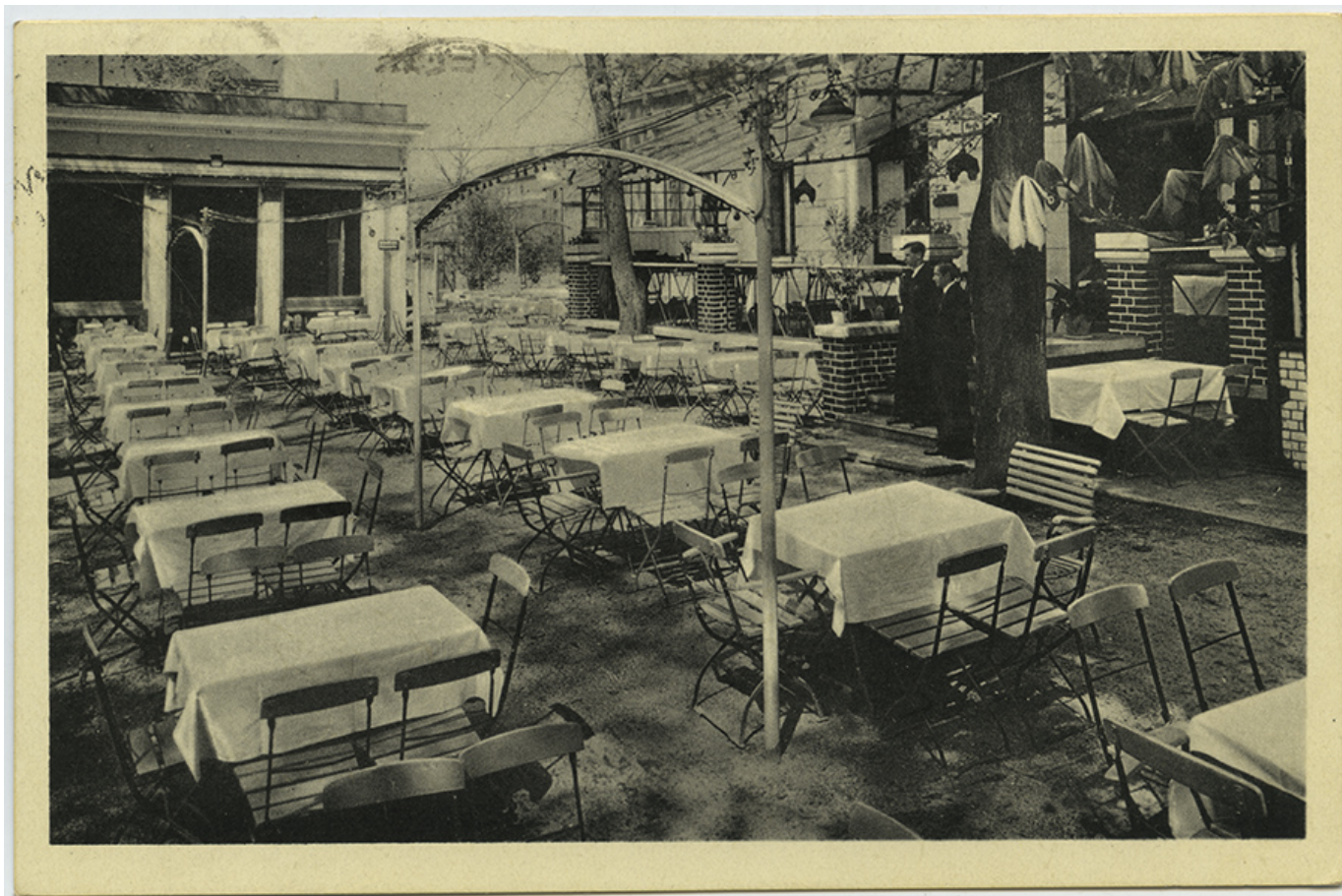
Restauracja „Eiskeller” przy ulicy Piastowskiej 17 ( ob. w tym miejscu mieści się Instytut Śląski).

także „Eiskeller” znajdujący się w centrum miasta przy Hafenstrasse 17 (obecnie ul. Piastowska). W lokalu można było dobrze zjeść, wypić i posłuchać muzyki. Miejsce to słynęło także z bardzo dużego ogrodu mieszczącego nawet kilkaset osób.