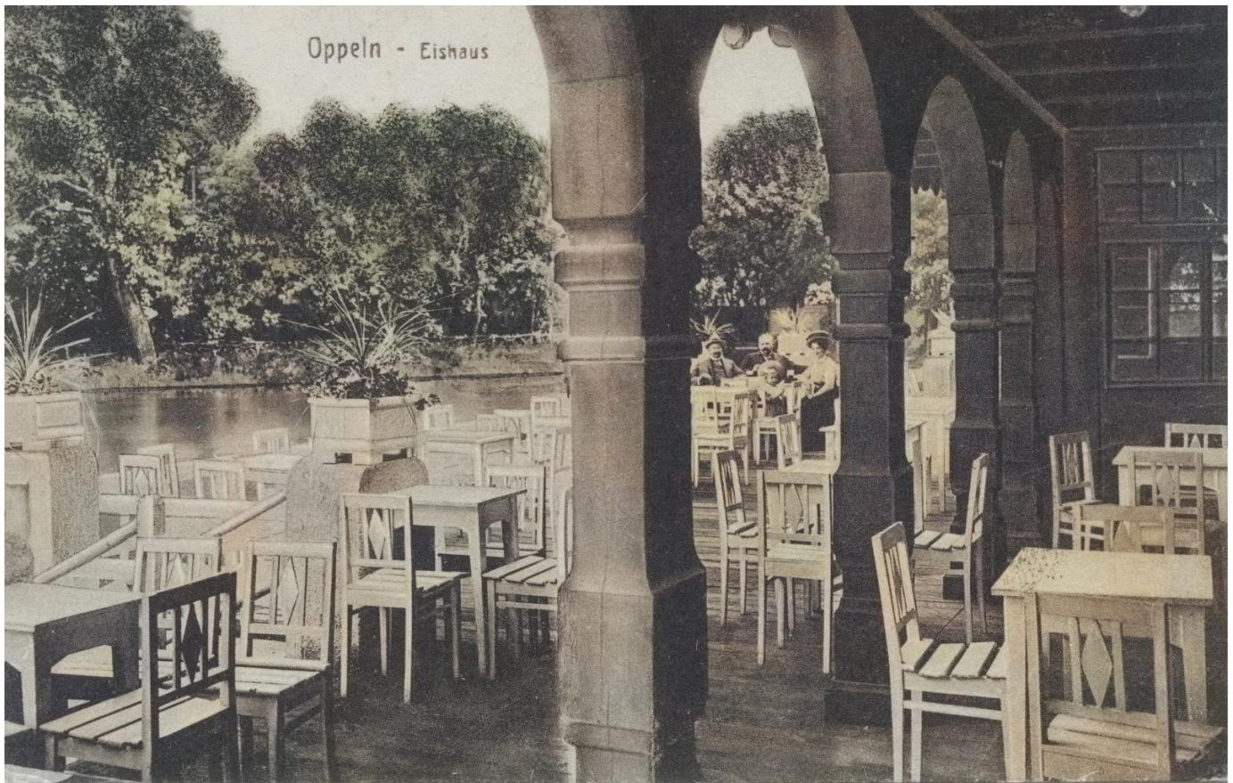
Domek Lodowy przy Stawku Zamkowym, ul. Barlickiego.