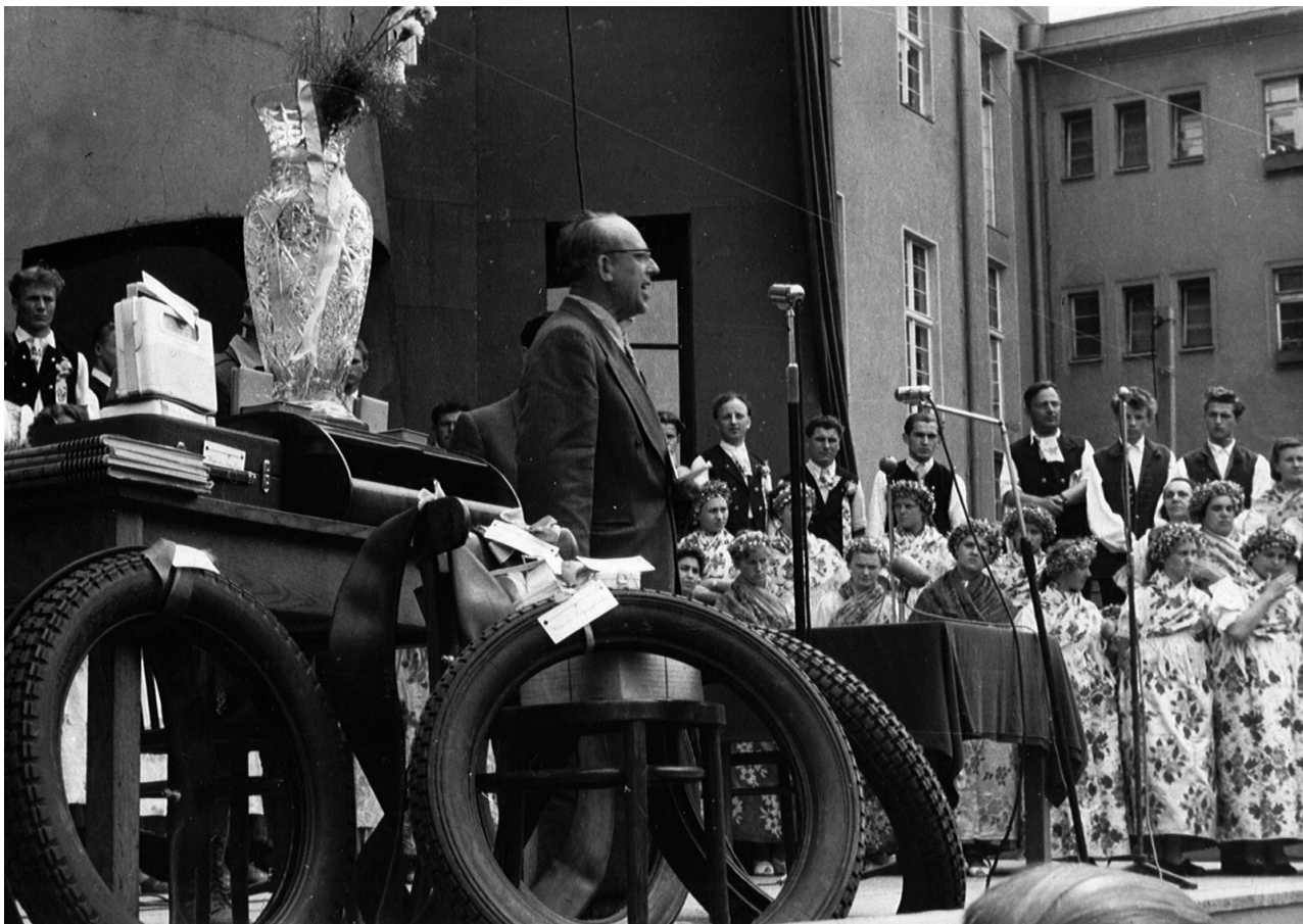
I Dni Opola, 1957 rok.

stworzenie ciągu turystyczno-nadwodnego biegnącego wzdłuż Młynówki i Odry, oświetlonego, zadbanego, z miejscami wypoczynku, spacerów i przejażdżek rowerowych, stworzenie w centrum Opola - od dworca do ronda - ciągu gastronomiczno-handlowego, zlikwidowanie pustych, brzydkich miejsc w śródmieściu, a na Pl. Wolności utworzenie oazy zieleni i kwiatów, miejsca plenerowych wystaw i koncertów, gry w szachy, skata, z niezbędnym zapleczem sanitarnym. Ponadto Papa Musioł nalegał, by na Wyspie Bolko stworzyć centrum wypoczynku dla opolan, z trasami rowerowymi, kawiarniami, zagospodarowanym Potokiem Wińskim. A w całym mieście uruchomić place zabaw dla dzieci i sportowe boiska. Gdy zmarł w 1983 roku fakt ten odnotowały w zasadzie wszystkie polskie media. Na jego płycie nagrobnej Towarzystwo Przyjaciół Opola kazało umieścić słowa Papy: „Święte Opole - pachnące kwiatami, śpiewające i wypełnione muzyką - jest moją miłością”.