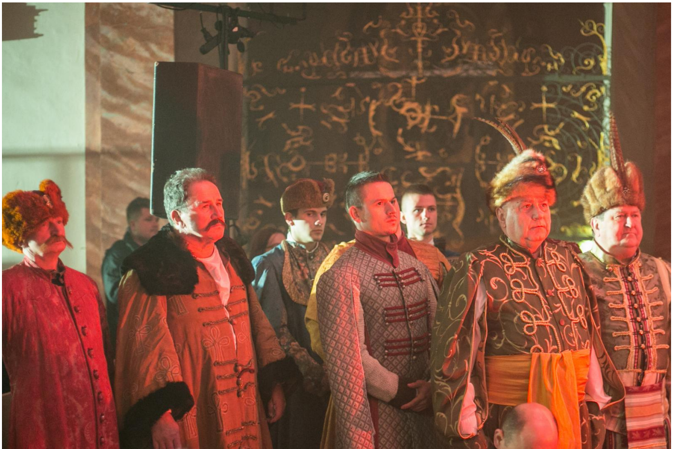
Inscenizacja z okazji 800 – lecia Opola

Jego głos, tubalny i silny, odbijał się od kamiennych ścian, wywołując w zebranych dreszcz emocji. Szlachcianki spoglądały na królową, szukając w jej spojrzeniu choćby iskry zainteresowania i atencji. Magnaci trącali szabelki lub stukali obcasem, niecierpliwie czekając na słowa króla. Czy wiedzieli, że oto są świadkami historycznej chwili?