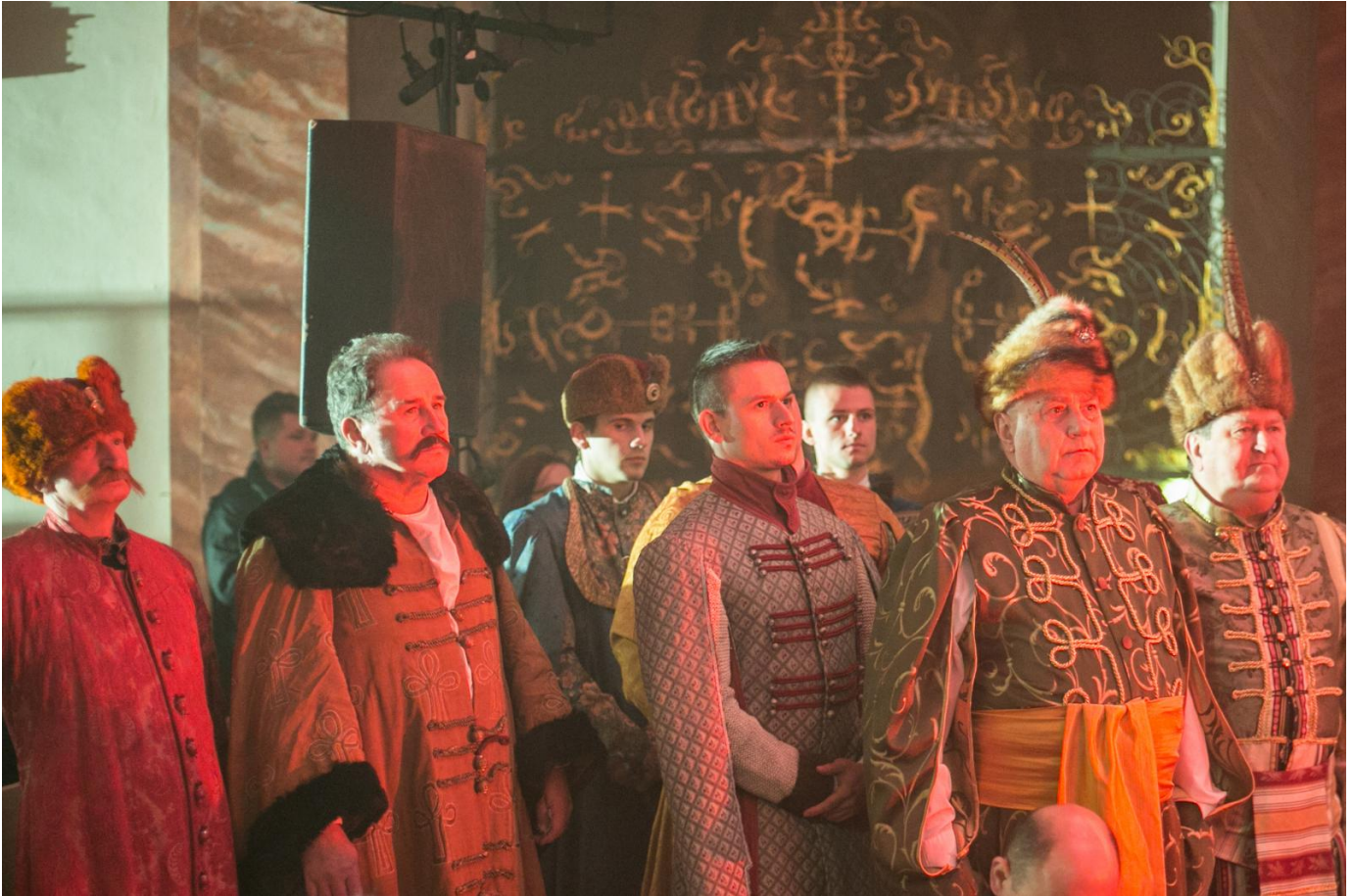
Inscenizacja z okazji 800 - lecia Opola