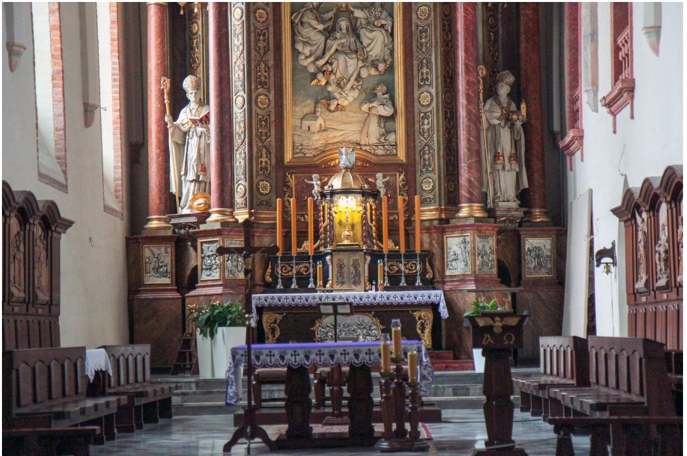
Ołtarz Kościoła Franciszkanów w Opolu, Fot. Anna Parkitna