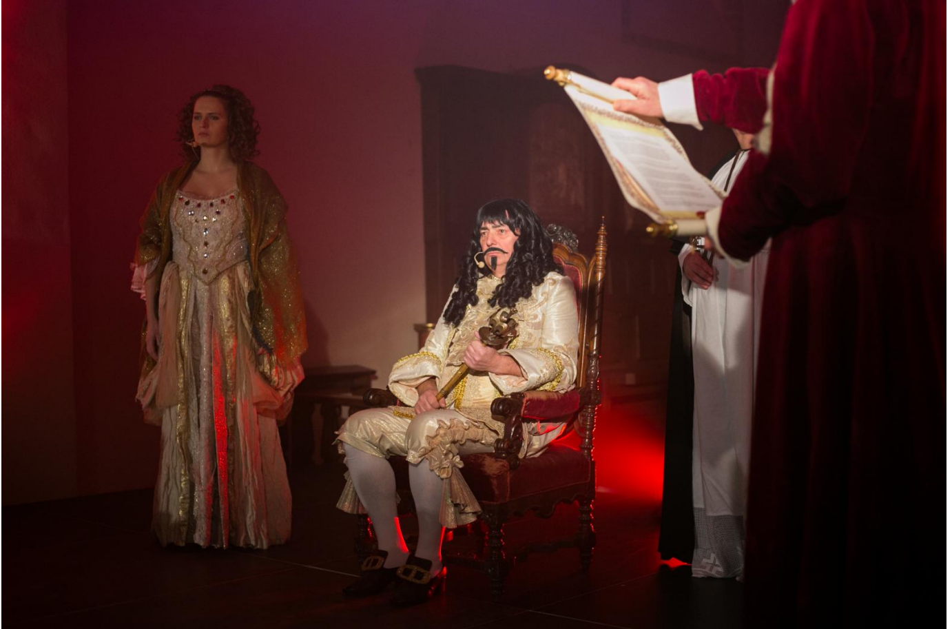
Inscenizacja z okazji 800 - lecia Opola, odczytanie uniwersału opolskiego, Fot. Sławomir Mielnik

wiernie Nam mili etc. Bogu samemu doskonałością swoją przenikającemu najskrytsze skrytości, wszystkiemu światu wrodzoną ciekawością, i istotnie dochodzącemu tejże skrytości, wiadomo dobrze, z jakową my żarliwością, a poddani Nam niektórzy oziębłością, drudzy przewrotnością, stawamy o dobro pospolite w pieczołowaniu.