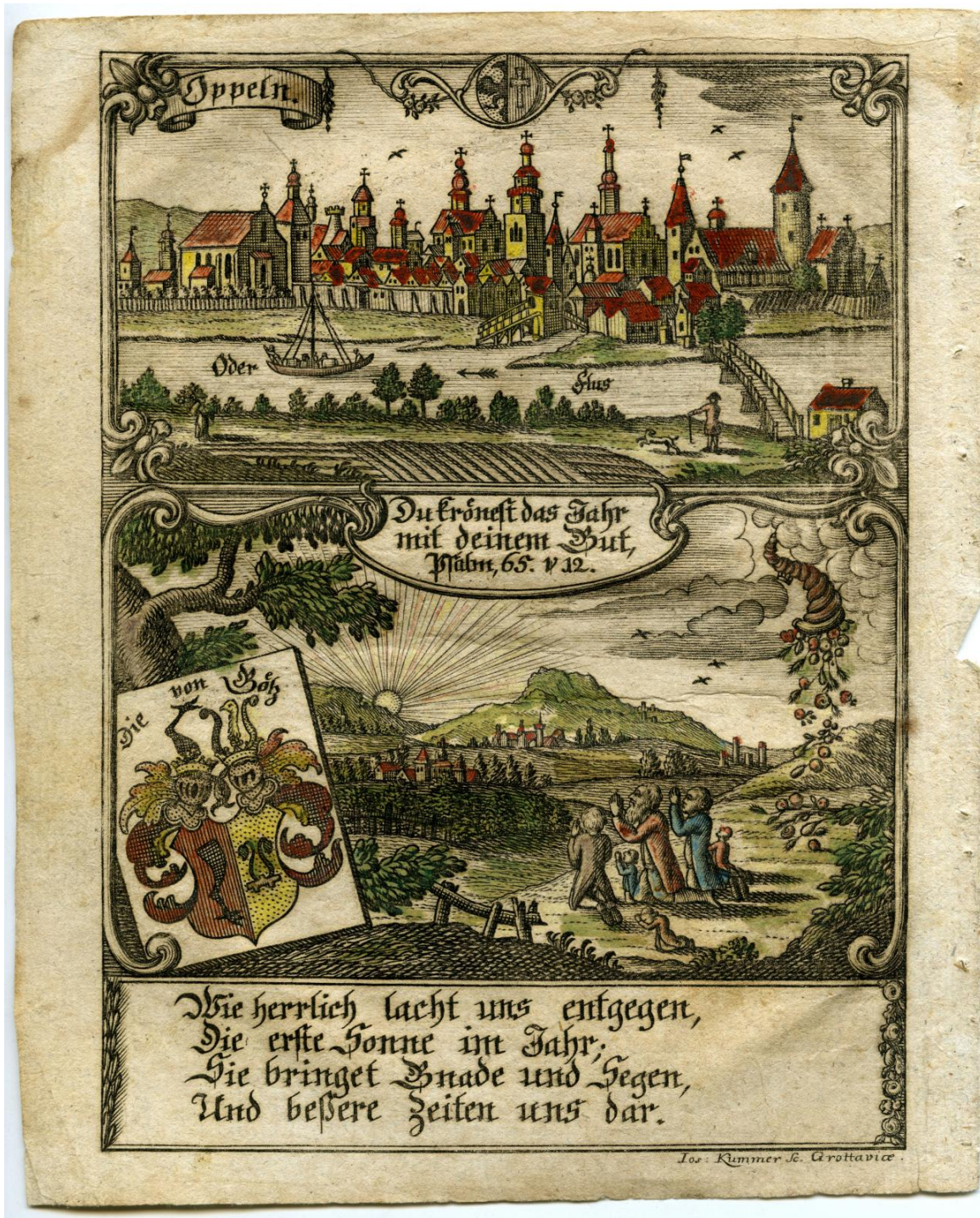
Grafika z archiwum Muzeum Śląska Opolskiego

W latach 1232-1239 kościół pw. Świętego Krzyża podniesiono do rangi kolegiaty. W XIII wieku nastąpiła duża zmiana w wizerunku świątyni. W latach 1254-1295 w