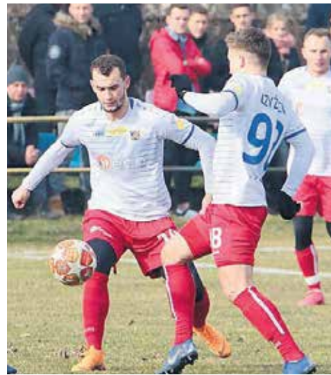
Piłkarze Odry Opole zaczynają wiosnę