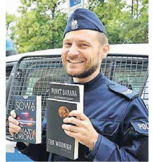
Najlepszy kryminal >3 napisał nasz policjant >10

GAZETA BEZPŁATNA 25 LUTEGO 2020 NR 4 (19)