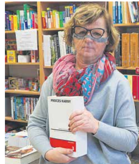
Wspólnie możemy uratować księgarnię > 9