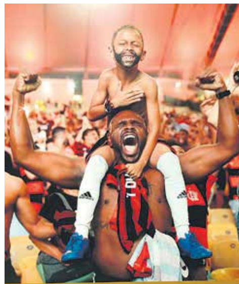
Wystawa World Press Photo tylko w Opolu! >5