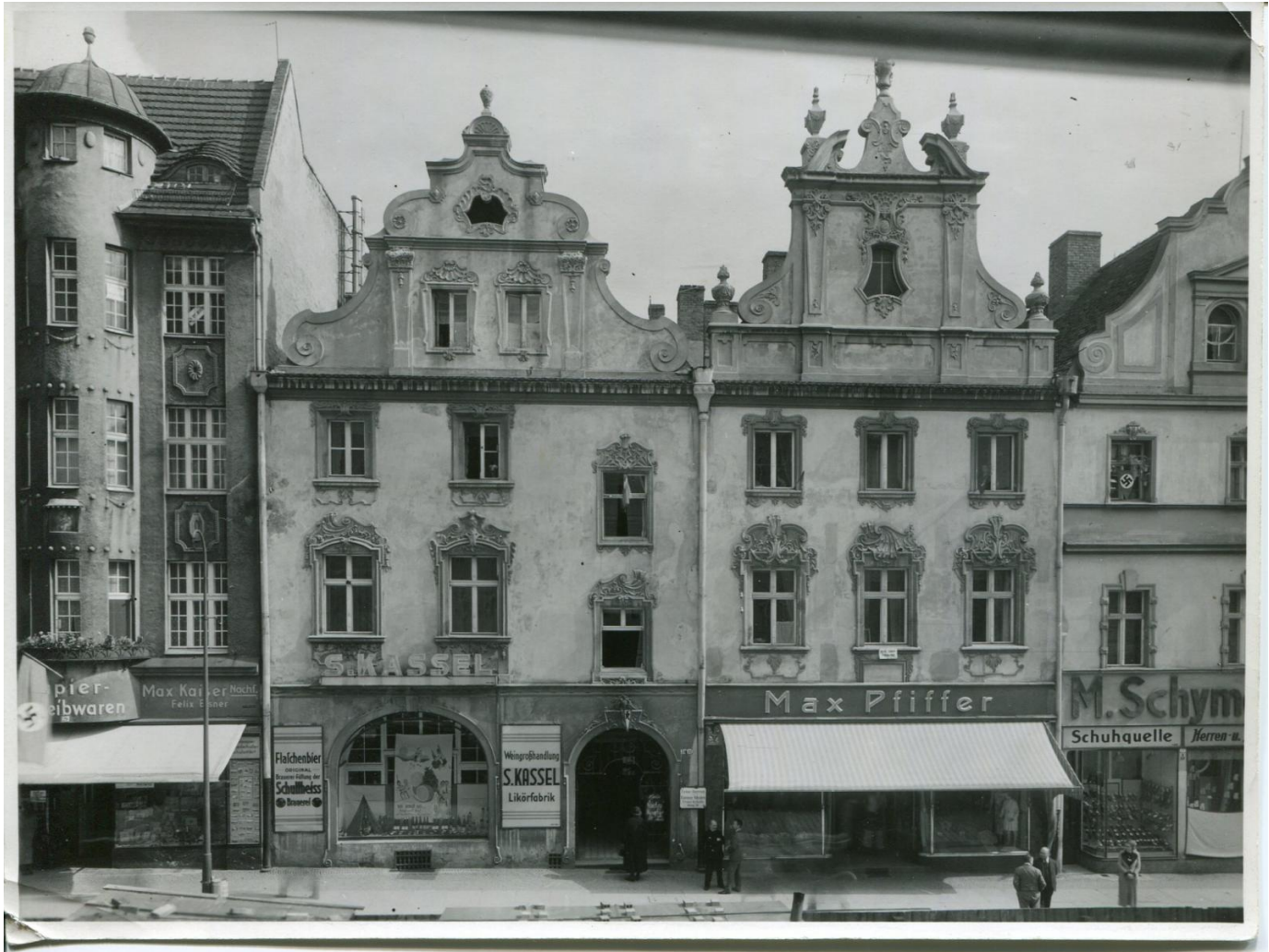
Południowa pierzeja rynku, lata 30. XX wieku