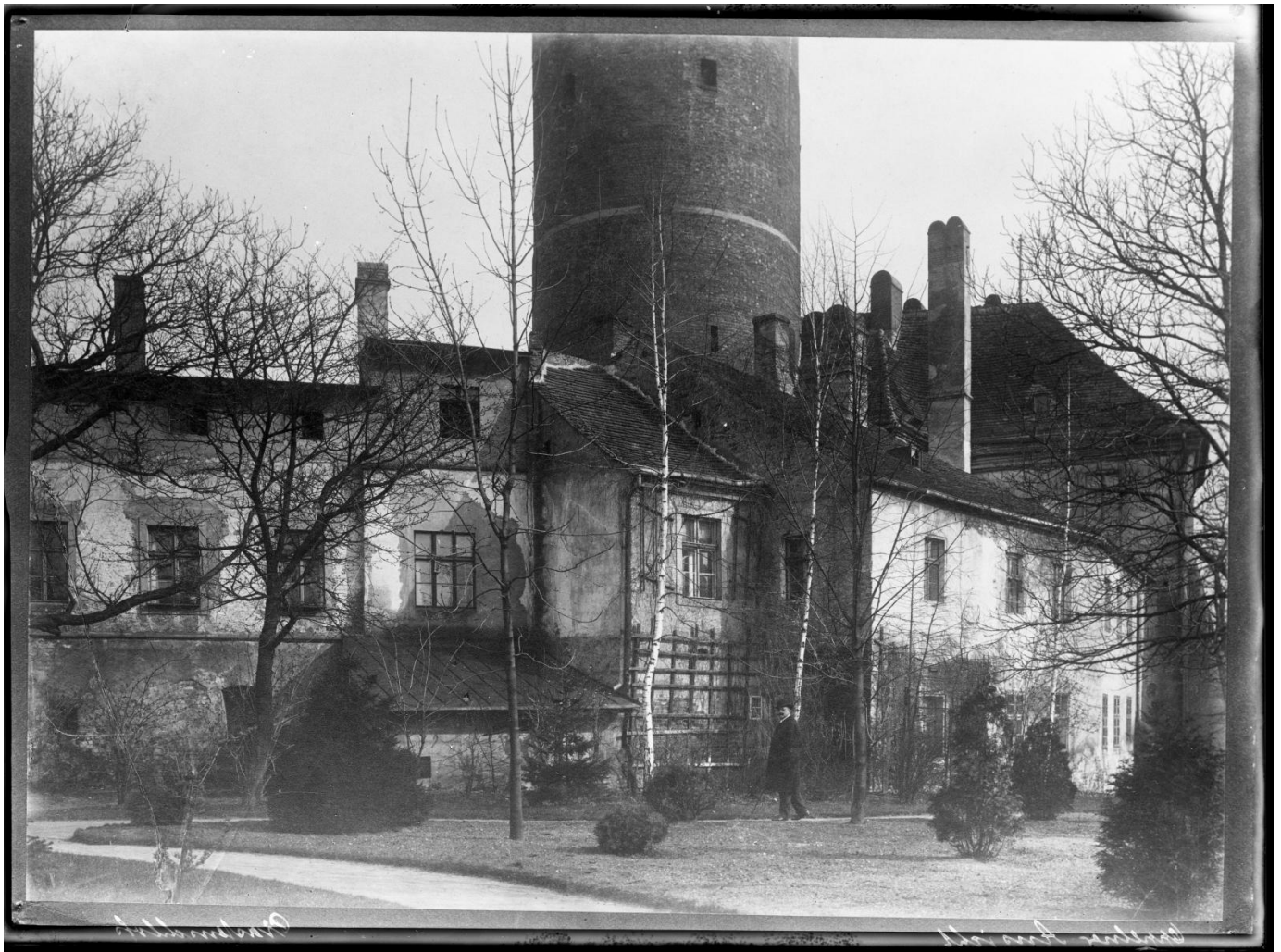
Zamek Piastowski w latach 20. XX wieku.