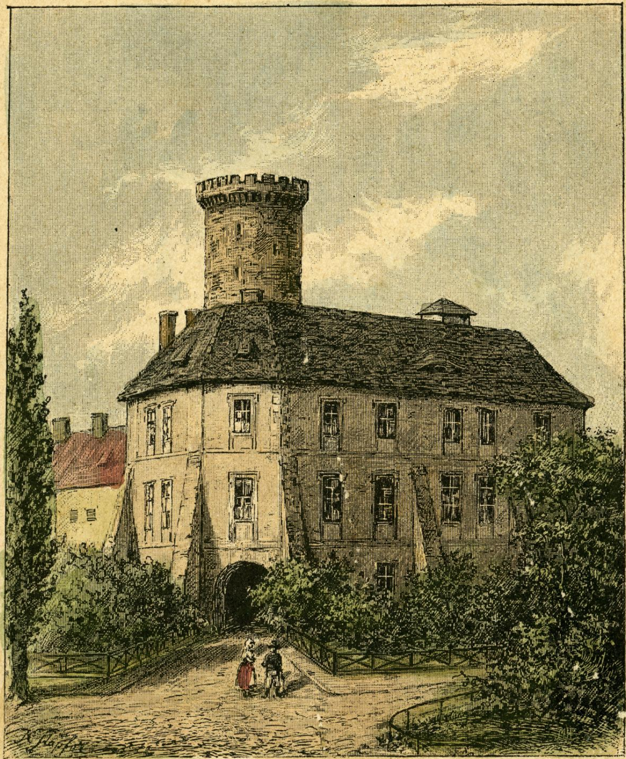
Pozůstatky zámku opolského.