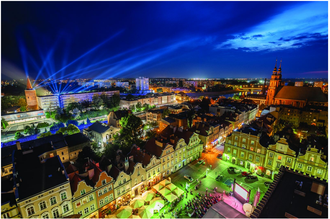
Wieża Piastowska obecnie