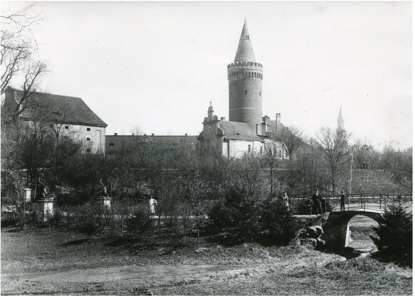
Zamek Piastowski i fragment parku zamkowego, widok od strony południowo-zachodniej, 1901 rok.