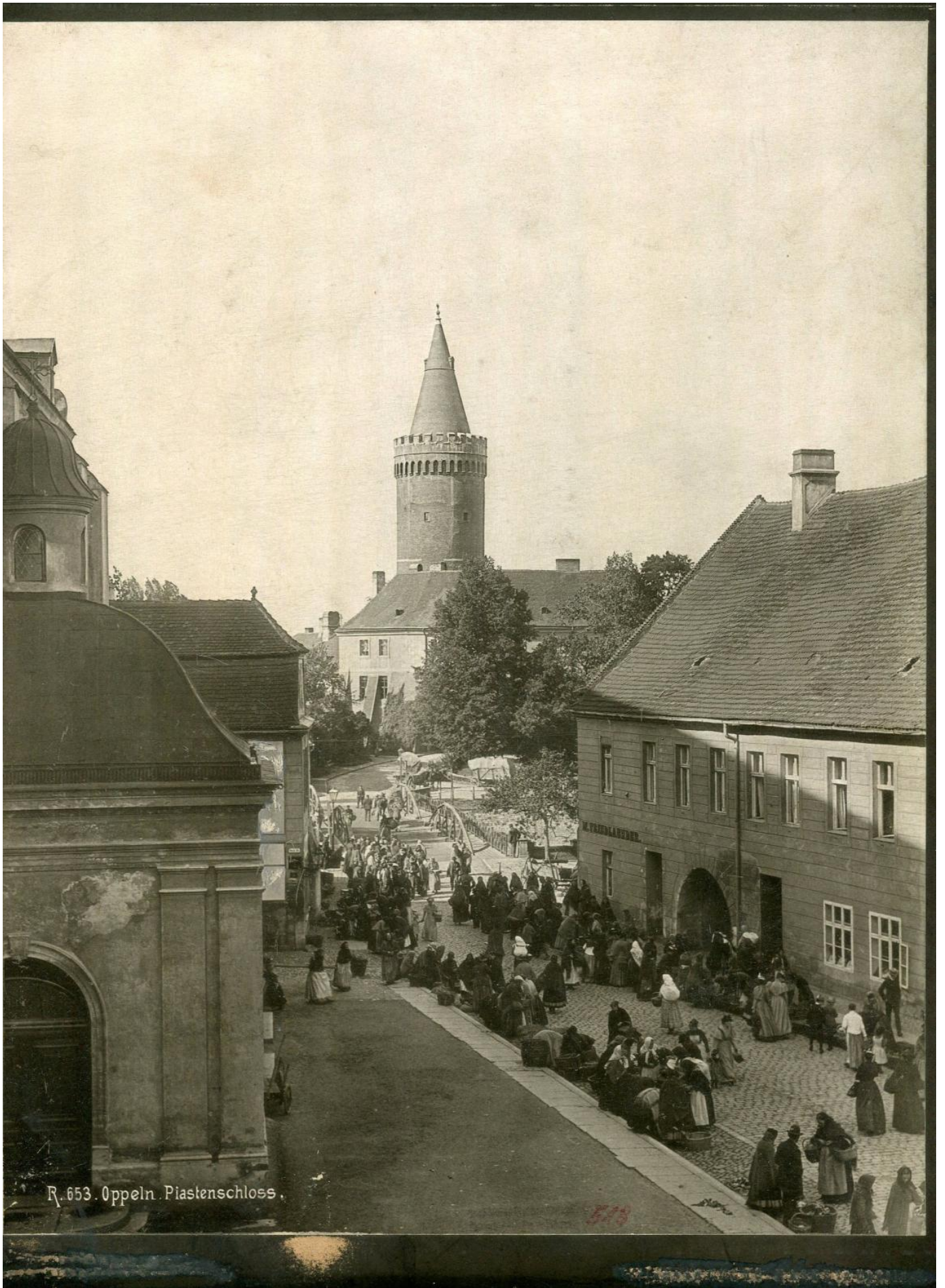
R. 653. Oppeln. Piastenschloss.