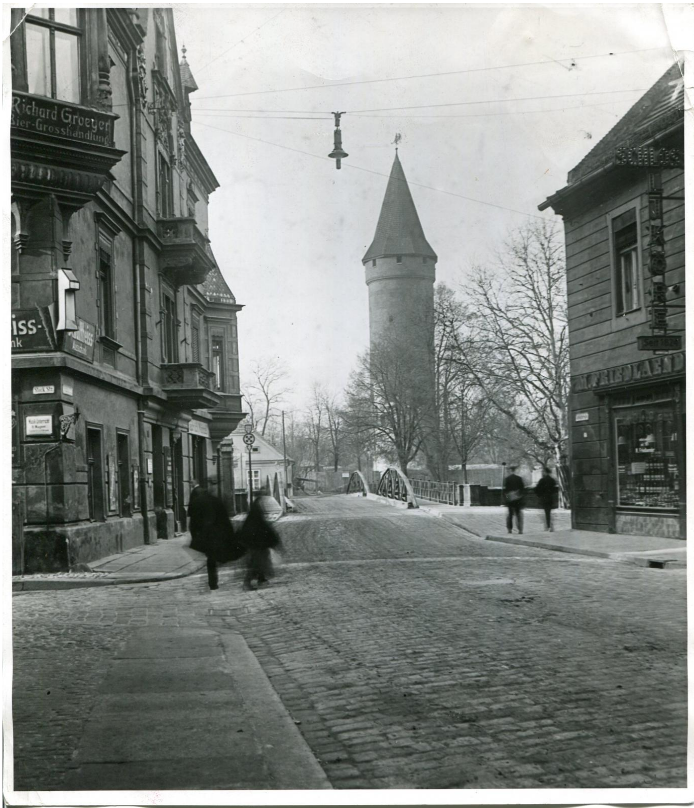
Ulica Zamkowa po rozbiórce Zamku Piastowskiego, ok. 1930 rok.