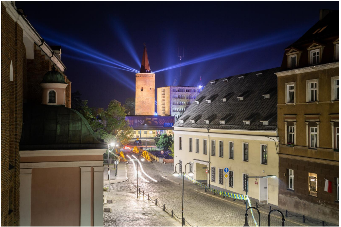
Wieża Piastowska obecnie