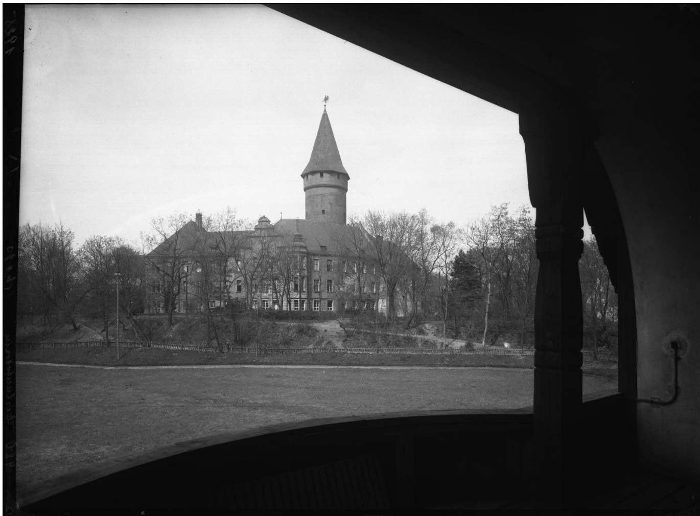
Widok od strony stawu zamkowego, lata 20. XX wieku.