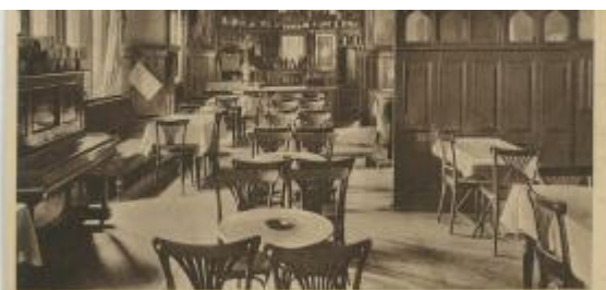
Café und Conditorei Ernst Schwigen, Oppeln, Strasse 2, Ecke Mühlstr. Tel. 44.