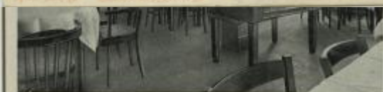
Gaststätte „Odermühle“ Inh. W. Klose - Oppeln, O.-S.