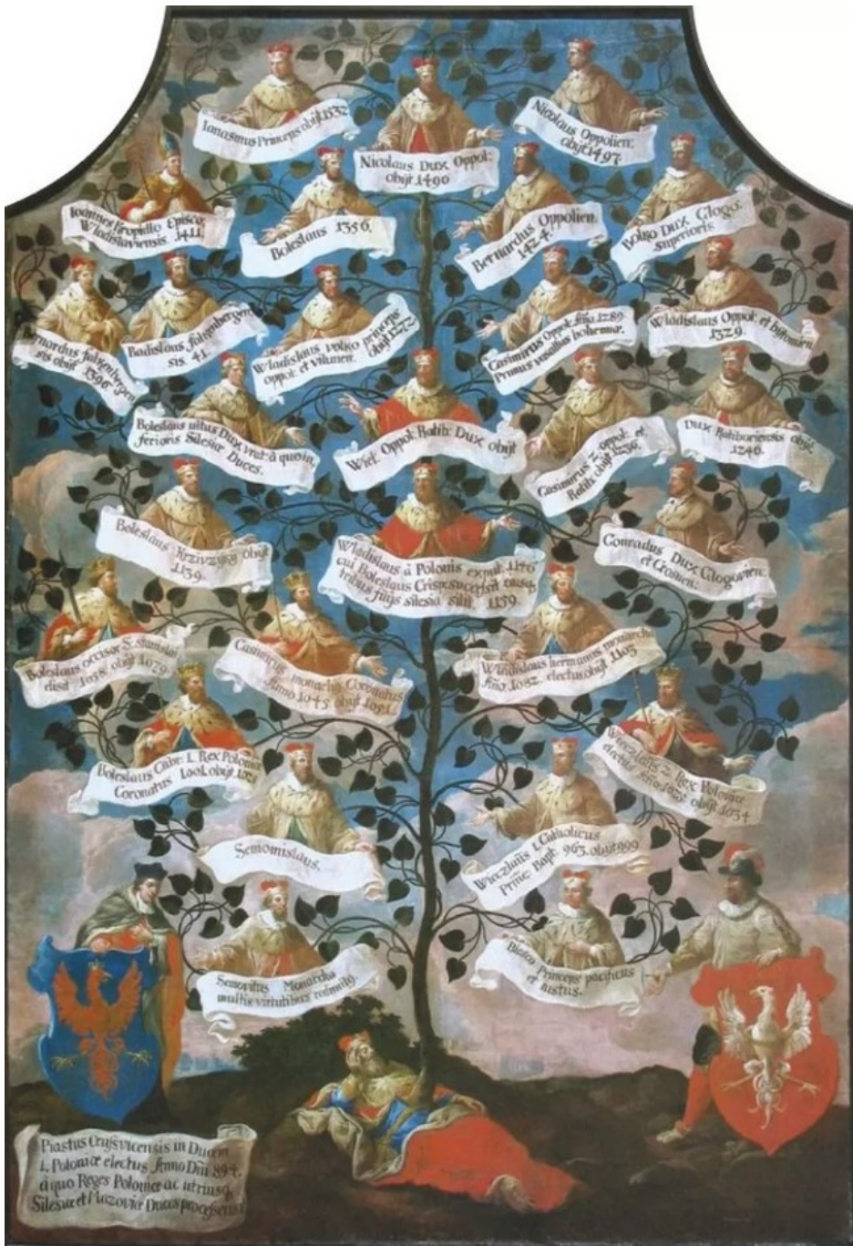
Drzewo Genealogiczne Piastów Opolskich ok. 1700 r. Katedra Świętego Krzyża w Opolu